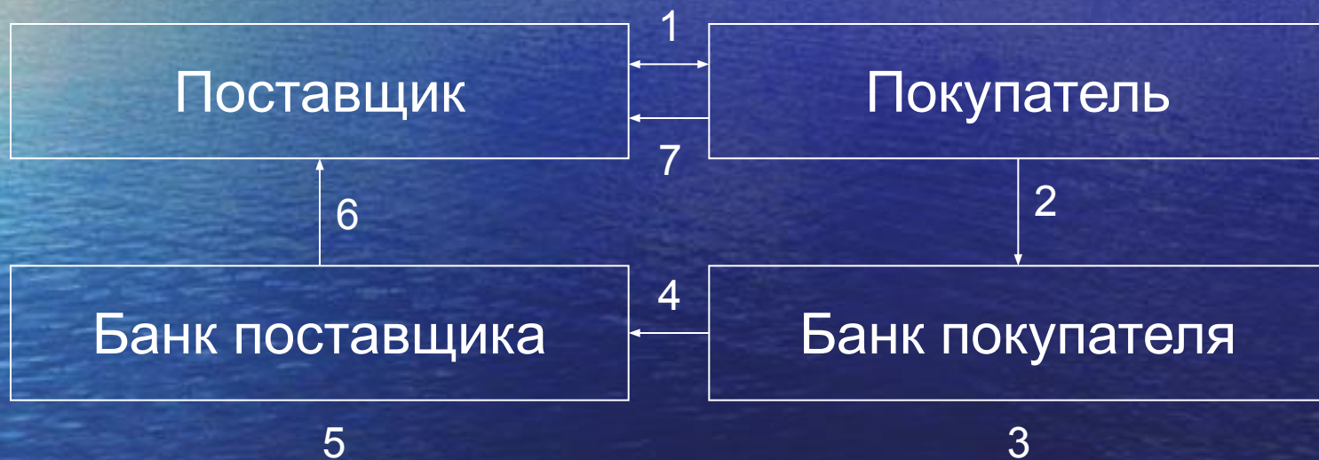
Схема расчета платежными поручениями при оплате товара: