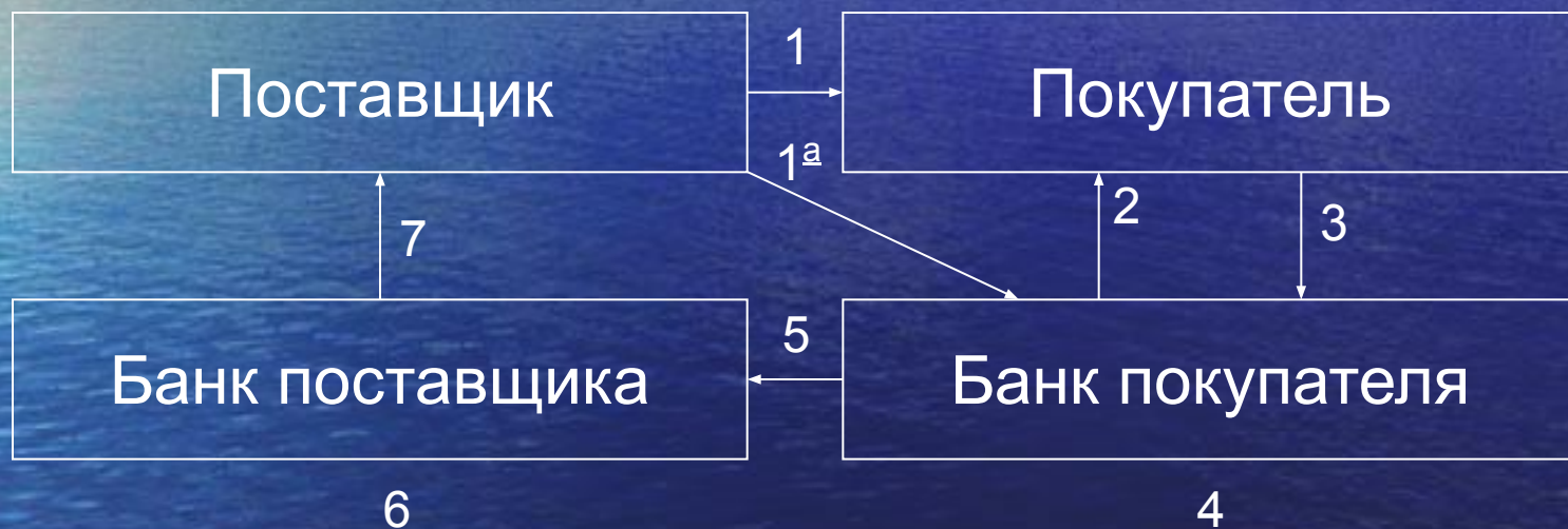
Схема расчета платежными требованиями - поручениями