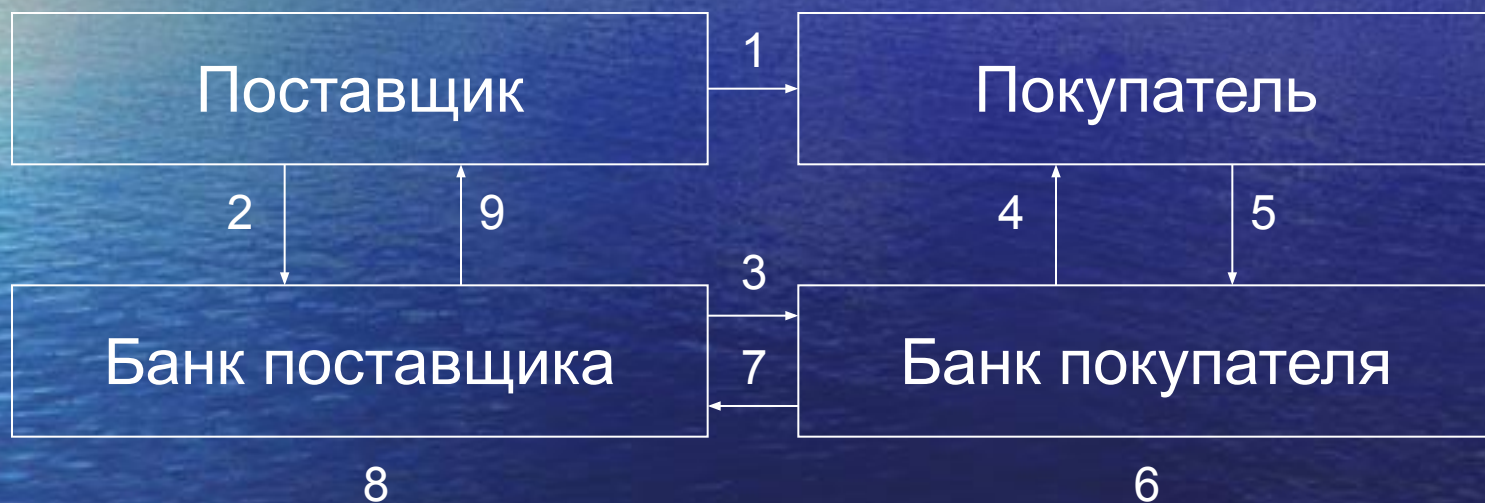
Схема расчета платежными требованиями (с предварительным акцептом)