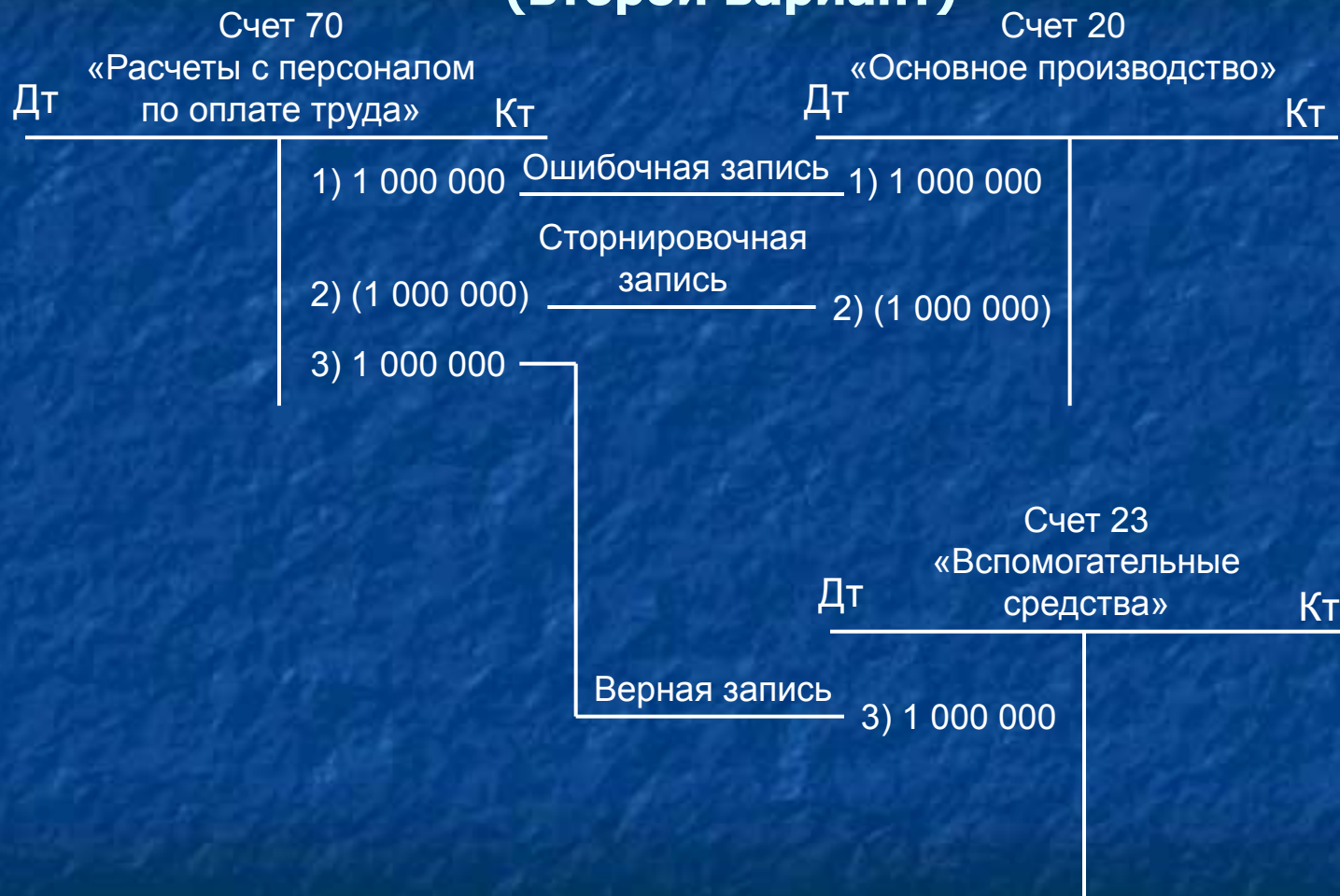
Схема отражения на счетах сторнировочных записей (второй вариант)