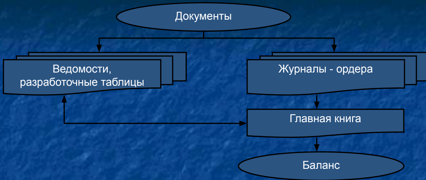
Журнал – ордер №1 по кредиту счета 50 «Касса» За _____ г.