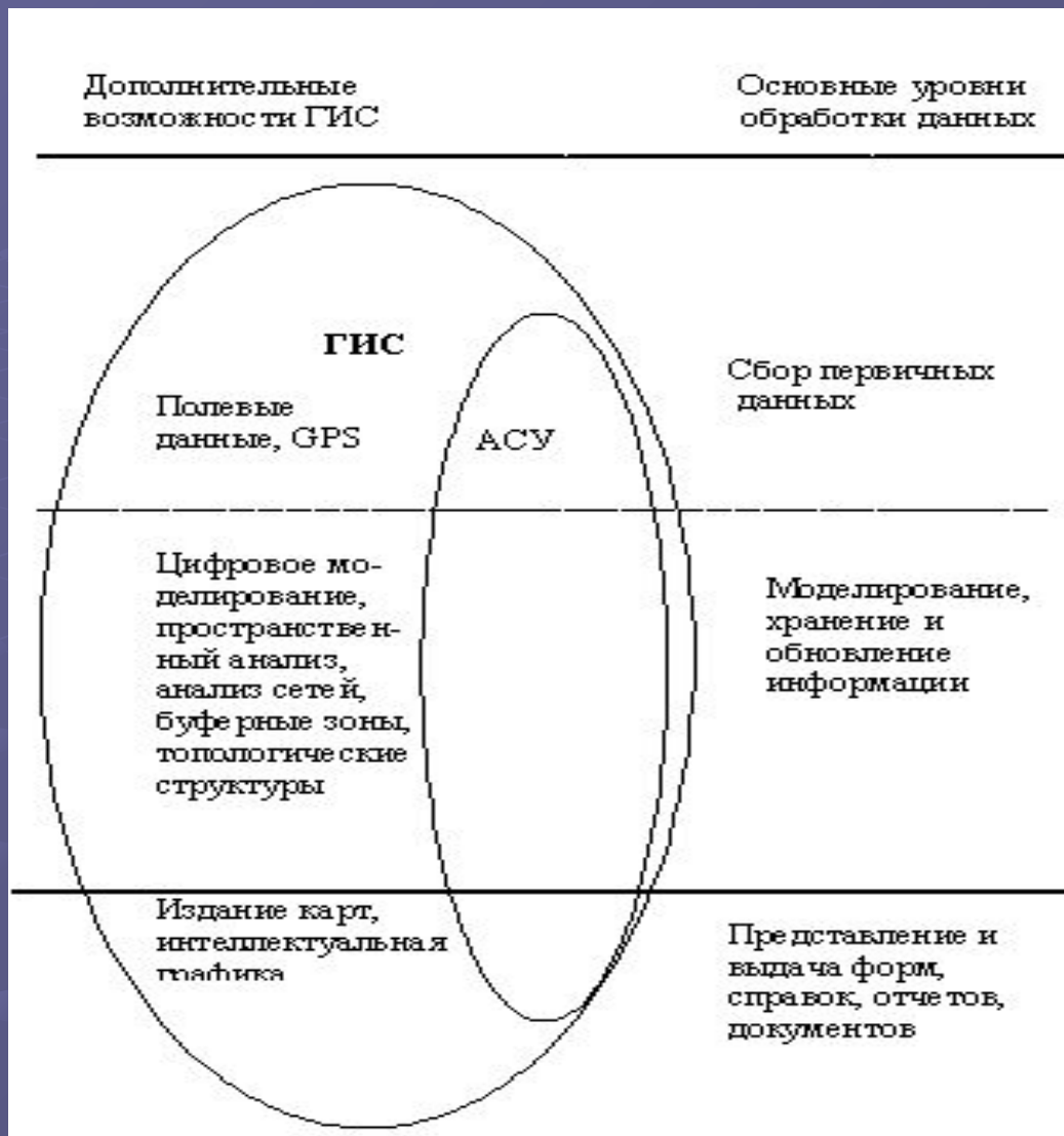
Рис. 3.2. Дополнительные возможности ГИС по сравнению с АСУ по основным уровням обработки данных