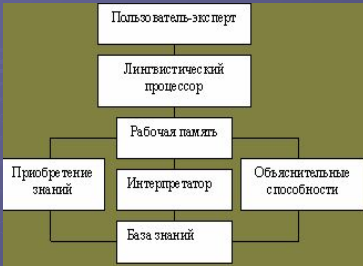
Рис. 3.3.Схема обобщенной экспертной системы