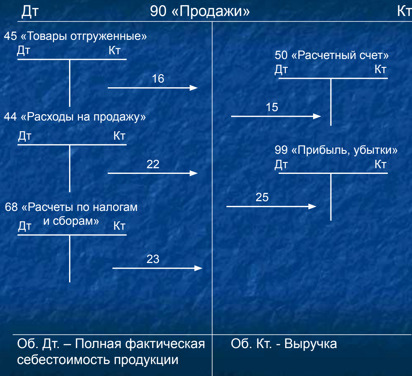
Схема учета процесса реализации