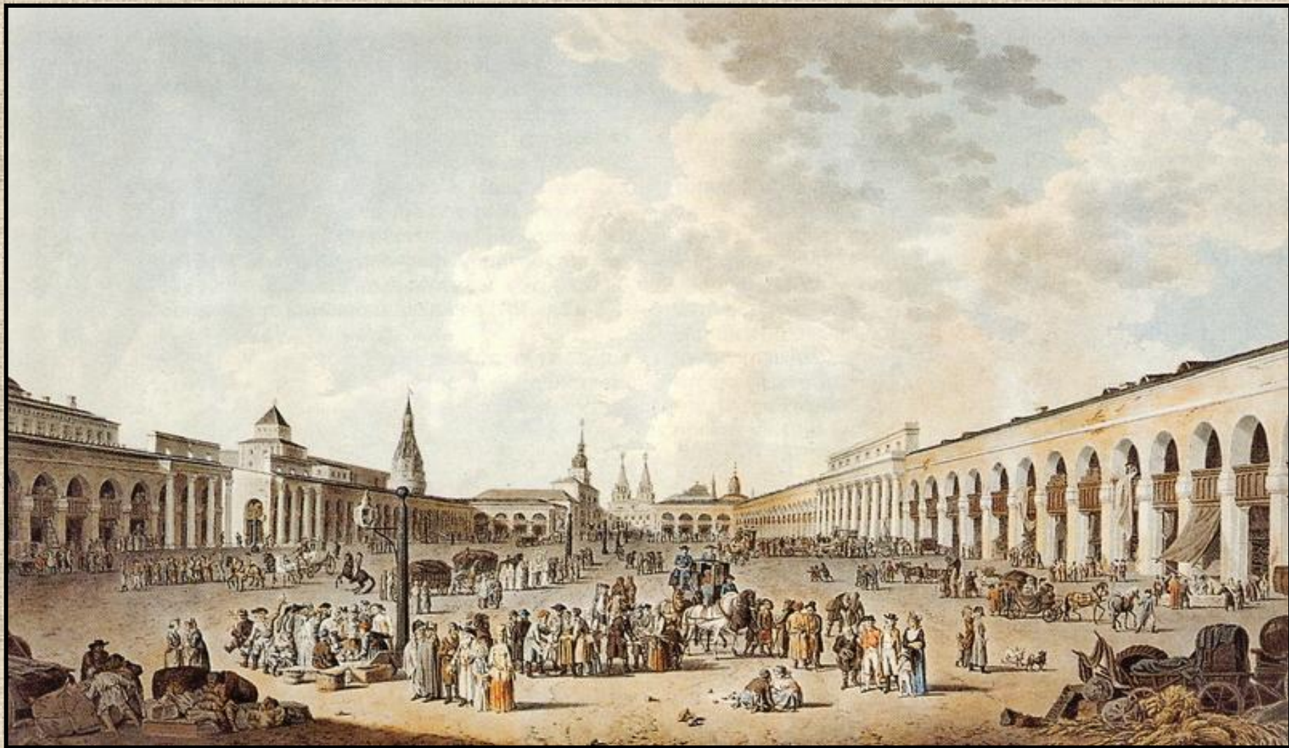
Москва, Красная площадь. XVIII век