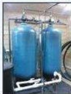
Установка для умягчения воды