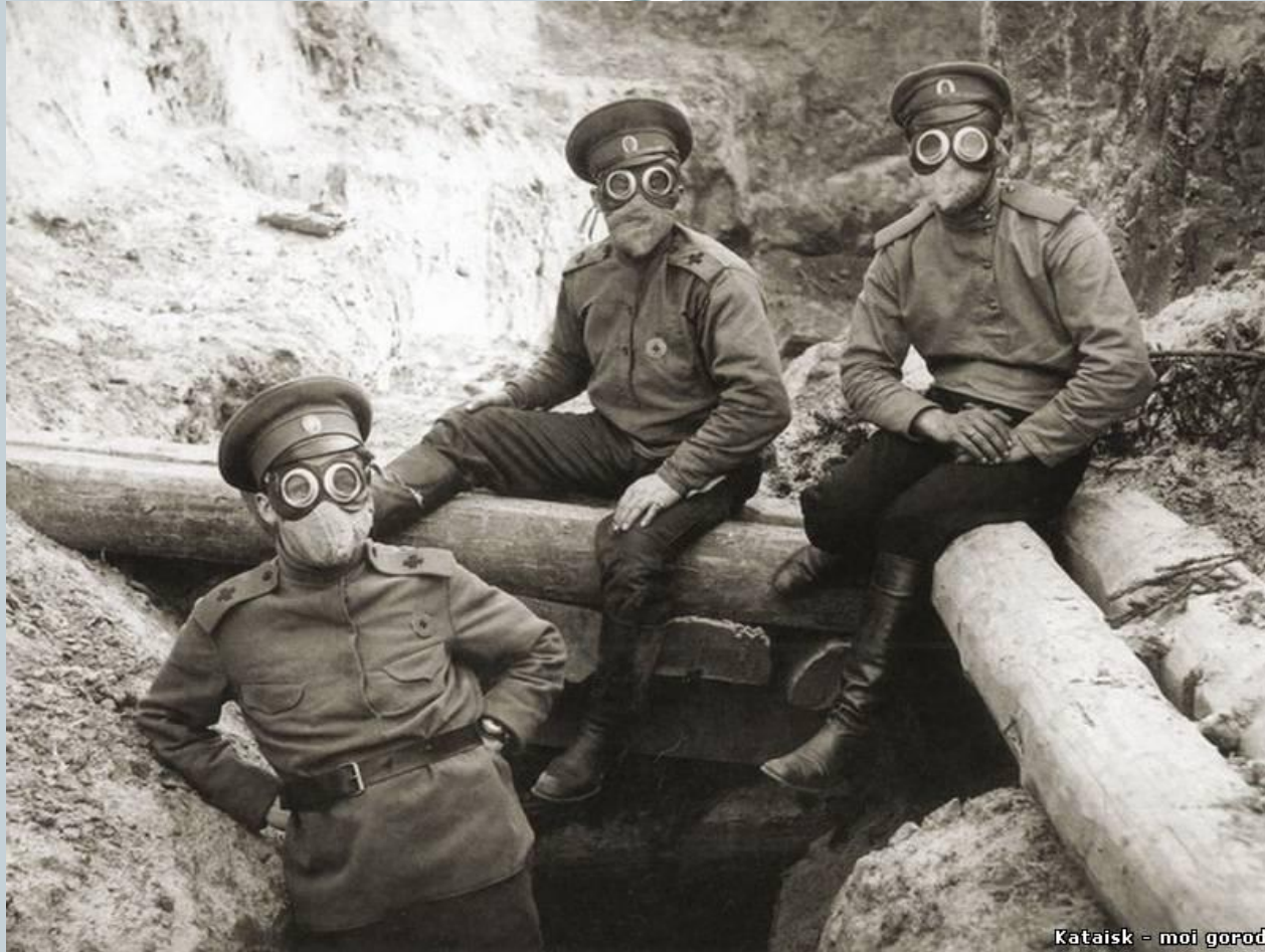
Kataisk - moi gorod

Вследствие применения химоружия и гибели большого количества солдат, было разработано и анти средство – противогаз.