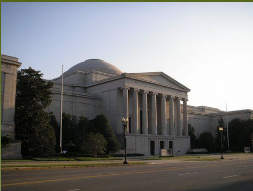
Национальная галерея искусств