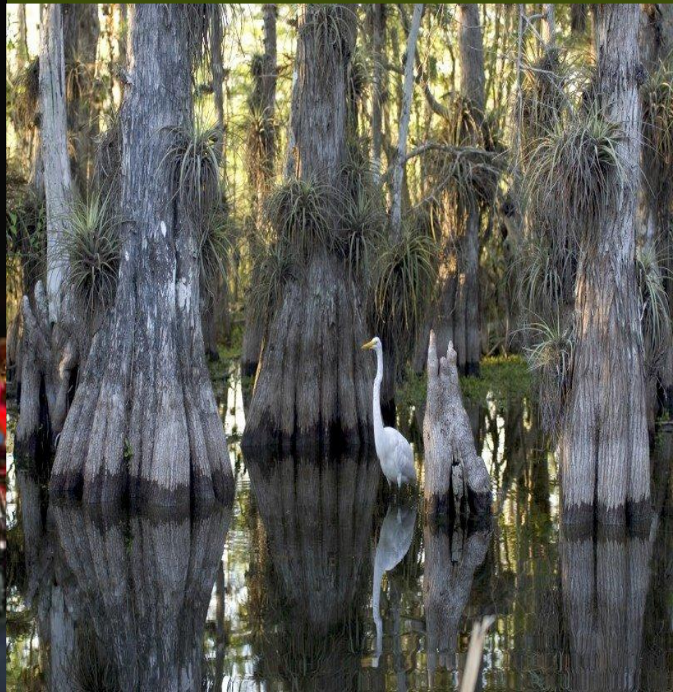
Национальный заповедник Эверглейдс