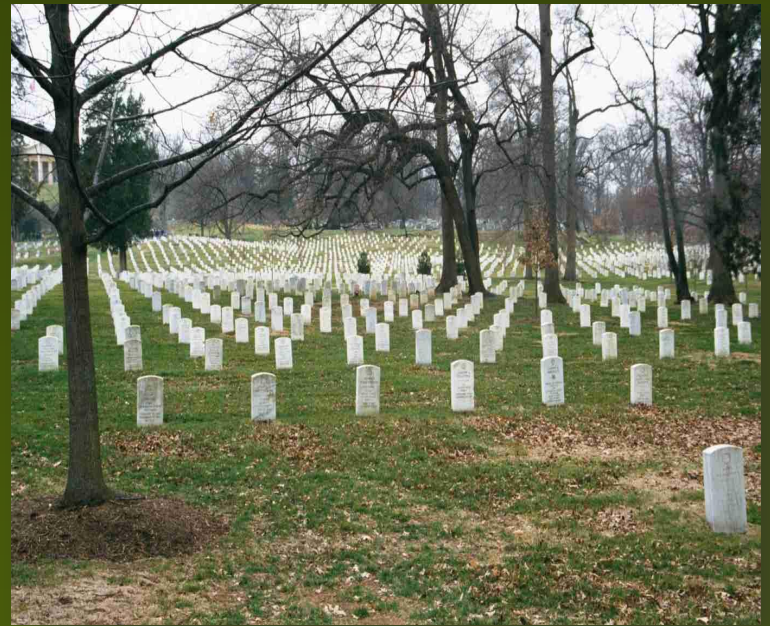
Арлингтонское мемориальное кладбище