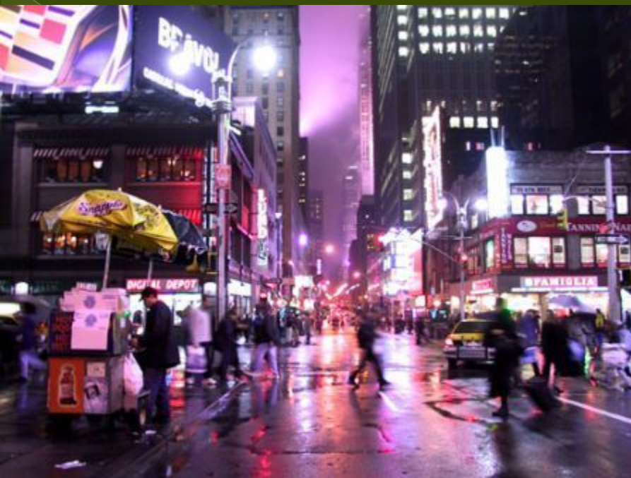
Бродвей – самая длинная улица Нью-Йорка