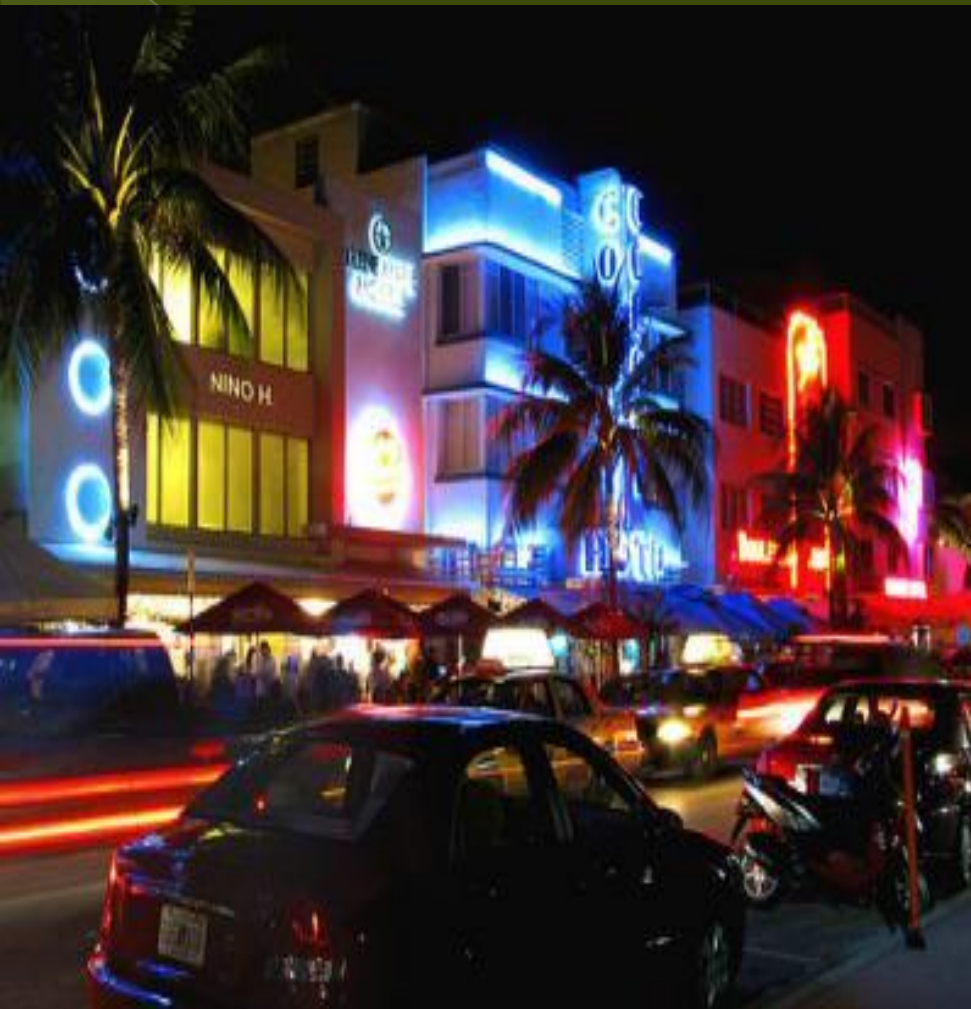
Район Арт Деко