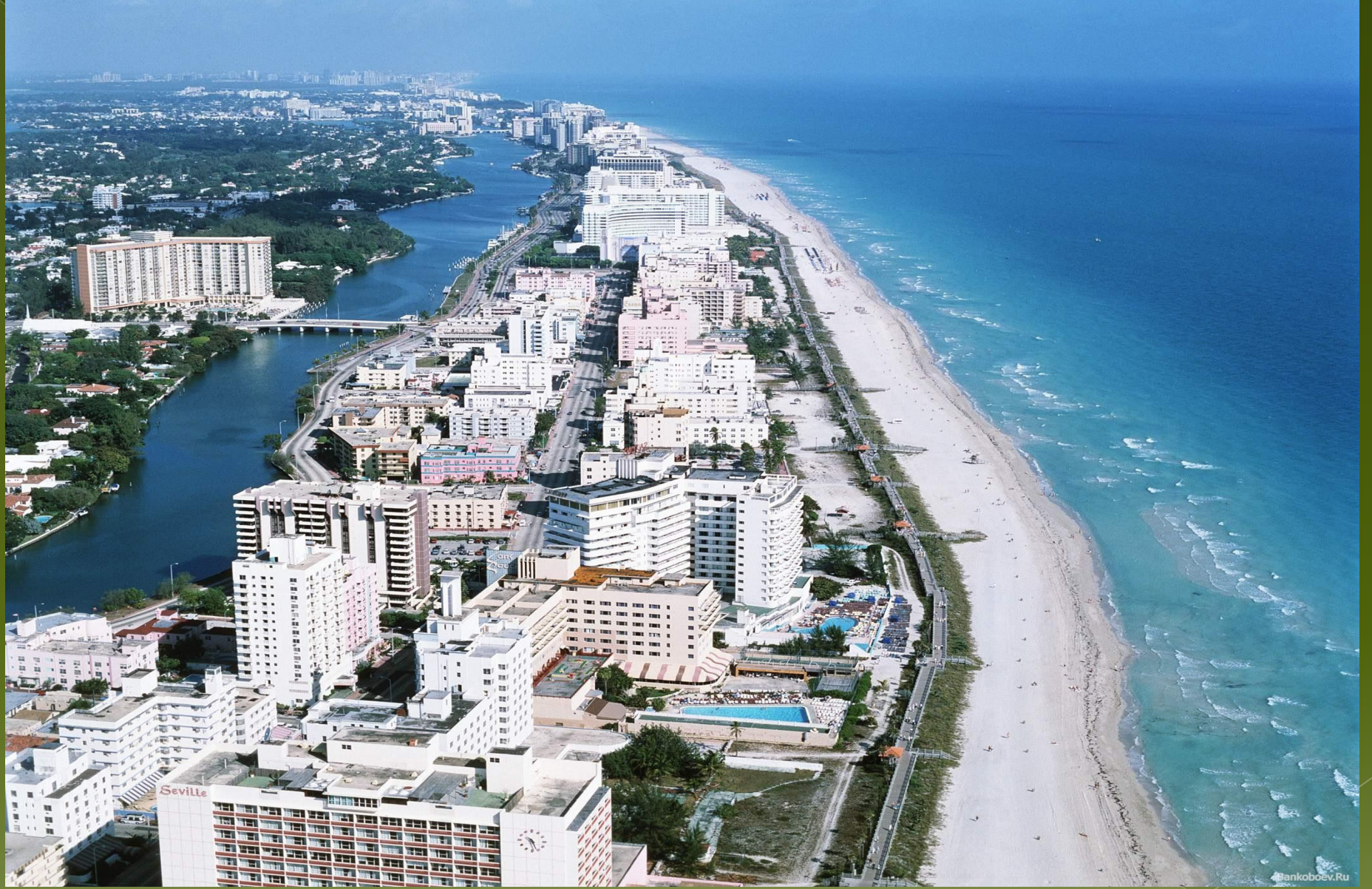
Майами-Бич – атлантический курорт