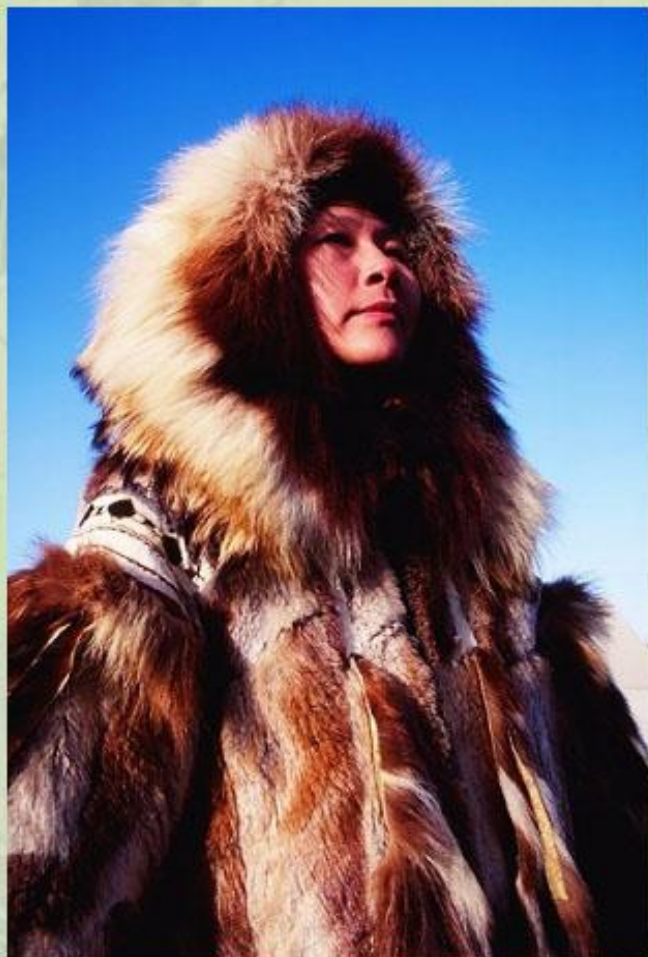
Малые народы Севера.

Не менее трагична судьба народов Севера в России, США и Канаде. В результате нефте- и газодобычи происходит сокращение площади естественных охотничьих угодий и оленьих пастбищ. Проникновение «чужих» людей на территории малых народов ведет к распространению эпидемий (например, гриппа), которые губительны для коренных жителей Севера.