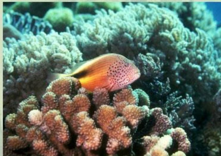
Большой Барьерный риф.

Узнать историю возникновения самого глубокого на суше Большого Каньона Колорадо вы сможете, прочитав статью Большой Каньон Колорадо .