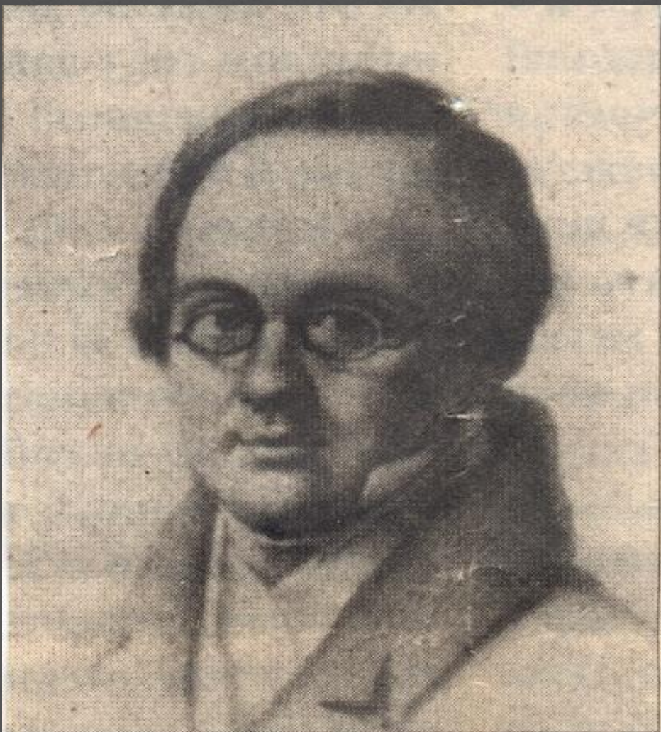
А.А. Дельвиг. Рисунок В. Лангера. 1830

Это Антон Дельвиг, по прозвищу Тося, Султан.