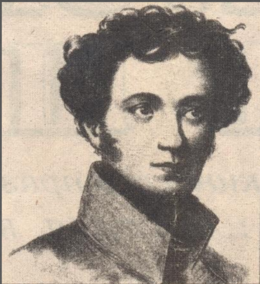
А. С. Пушкин в лицейском мундире. Литография с рисунка неизвестного художника. 1816–1817

А это сам Александр Пушкин. У него были прозвища Егоза и Француз.