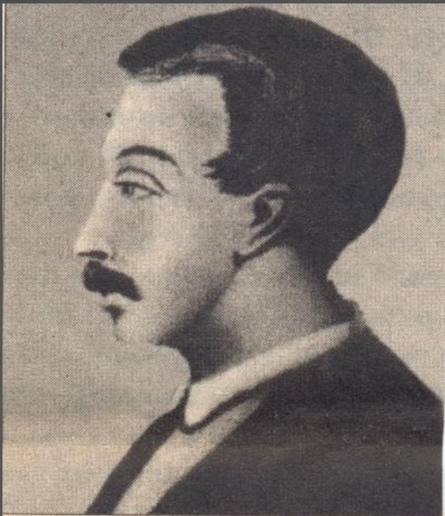
В.К. Кюхельбекер. Гравюра И. Матюшина

Это Вильгельм Кюхельбекер по прозвищу Кюхля или Бекеркюхель.