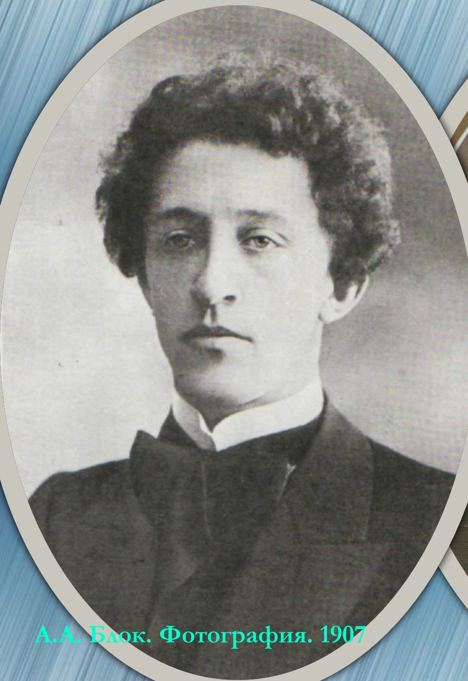
А.А. Блок. Фотография. 1907