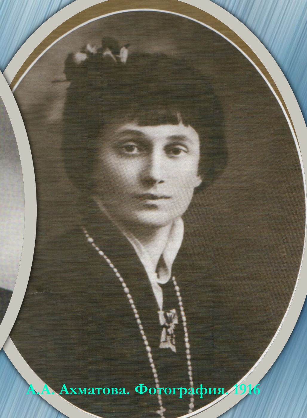
А.А. Ахматова. Фотография. 1916