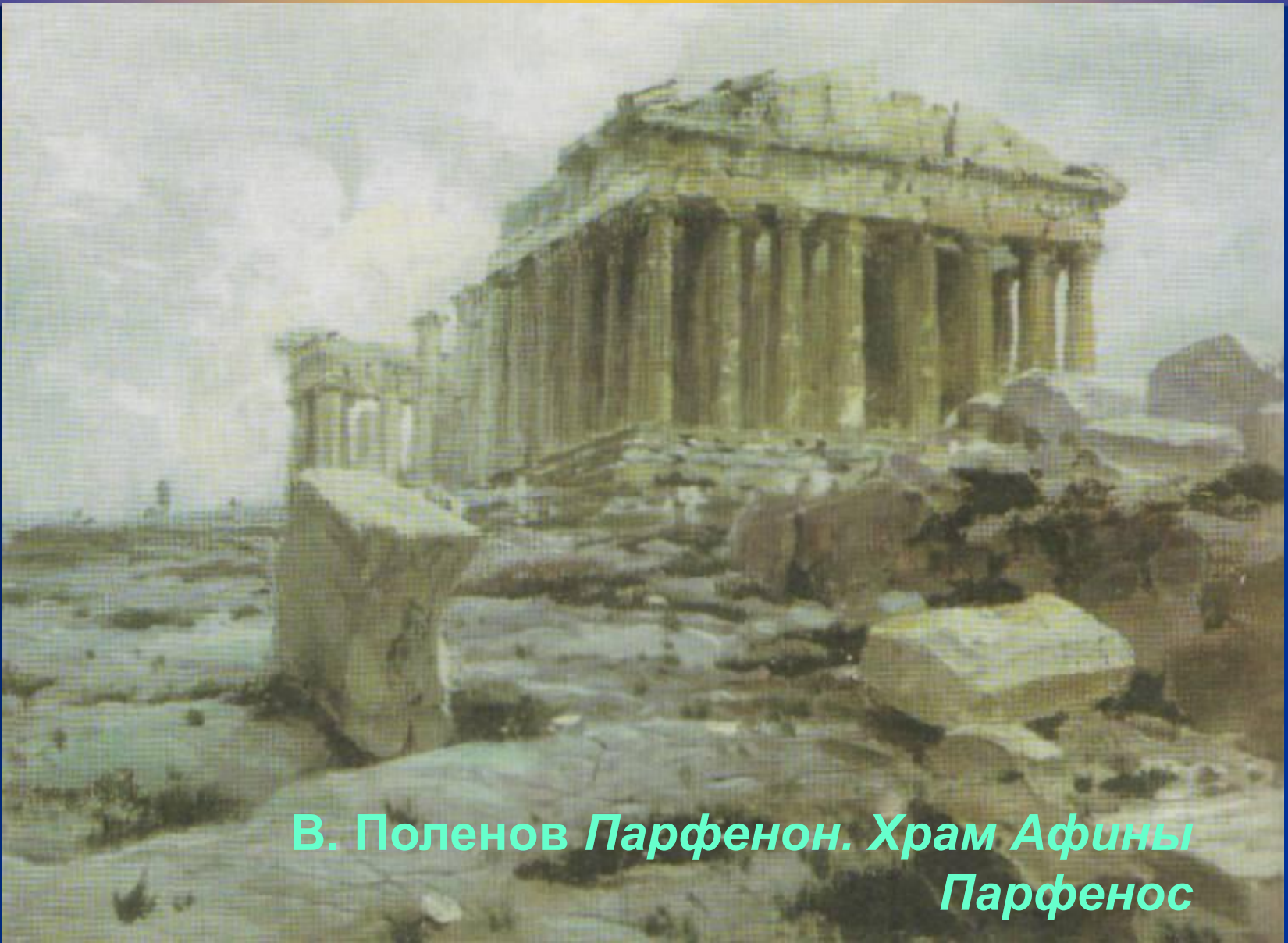
В. Поленов Парфенон. Храм Афины Парфенос