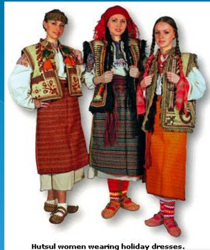
Hutsul women wearing holiday dresses.