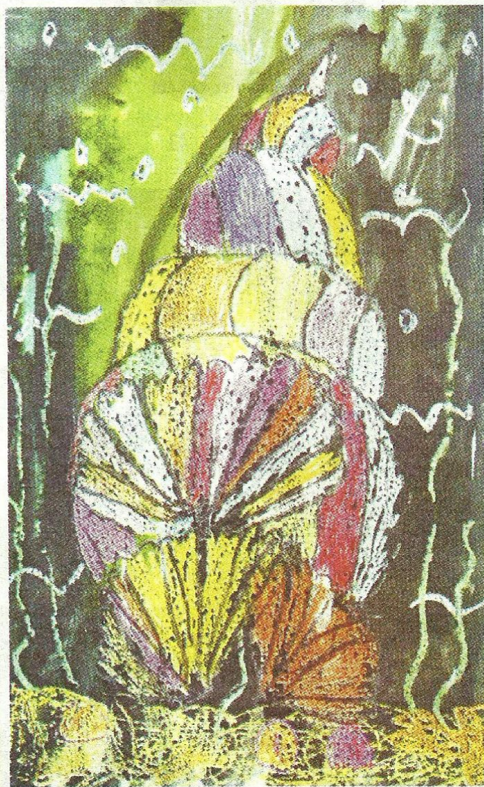
Баканова Юля, 6 лет. ДВОРЕЦ НА ПЛАНЕТЕ МОРЕЙ