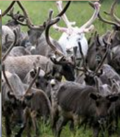
Полярная олени сова