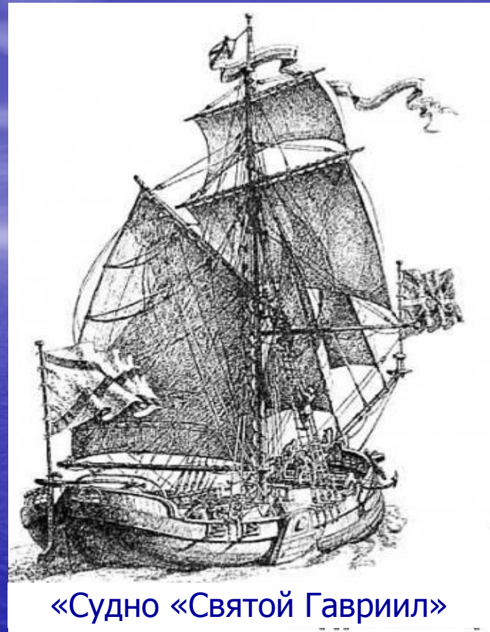
«Судно «Святой Гавриил»

Великий Петр I приветствовал дела, которые приносили мировую известность государству Российскому, и поэтому легко согласился на организацию экспедиции, предложенную голландскими учеными. Экспедицию, которая состояла из 100 человек, возглавил капитан 1 ранга Витус Беринг . Группе надлежало прибыть в район Камчатки, соорудить судно под названием « Святой Гавриил », достигнуть берегов Северной Америки и оставить о своем пребывании там память.