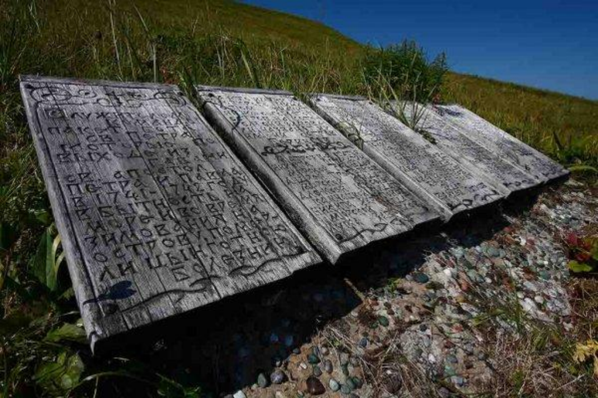
Памятные доски с именами моряков из команды Витуса Беринга