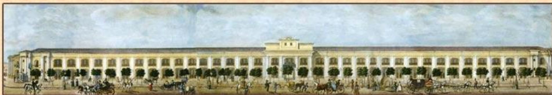
Гостиный двор. «Панорама Невского проспекта». Фрагмент. Садовников Василий Семенович. 1830-е гг.

Но лавки были некрасивы. Их снесли и построили каменное здание. Оно имело 2 этажа и состояло из 4х корпусов. Корпуса образовали неправильный квадрат, посередине которого был большой двор. Во дворе хранили товары, а в корпусах их продавали