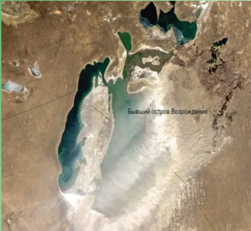
Бывший остров Возрождения