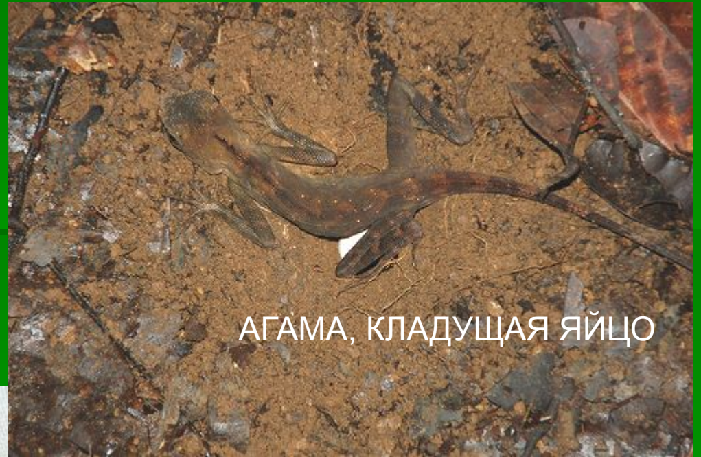
АГАМА, КЛАДУЩАЯ ЯЙЦО