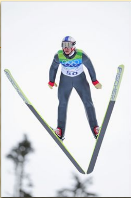
Прыжки с трамплина