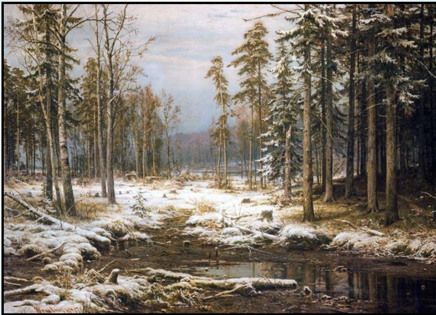
Первый снег. 1875