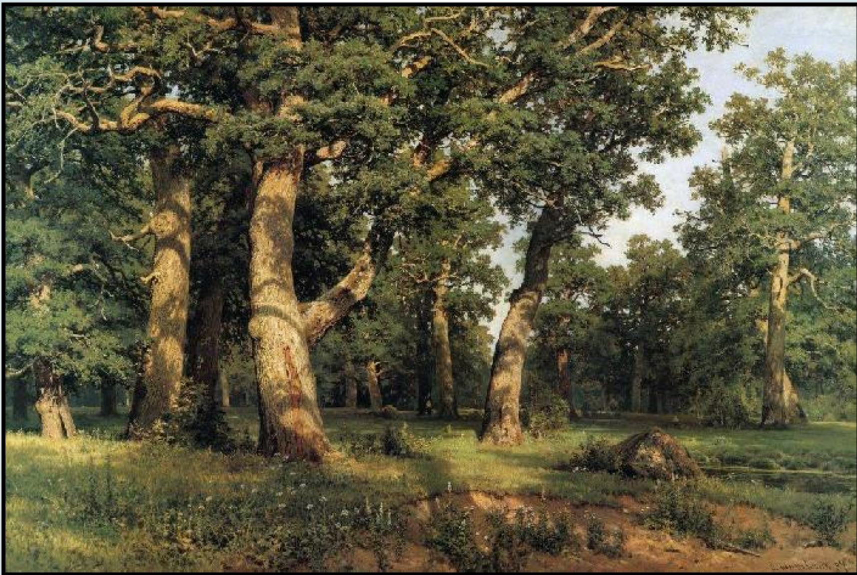
Дубовая роща. 1887