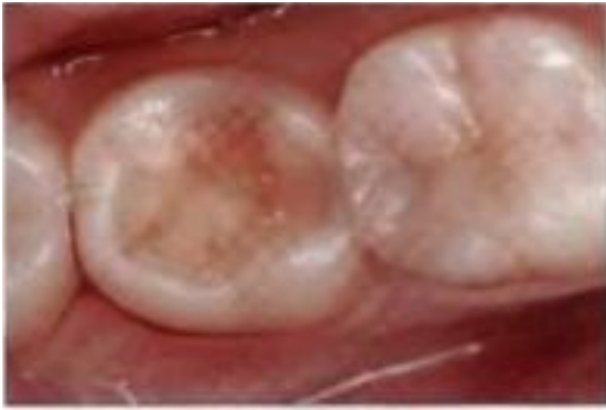
Большая полость во втором моляре.