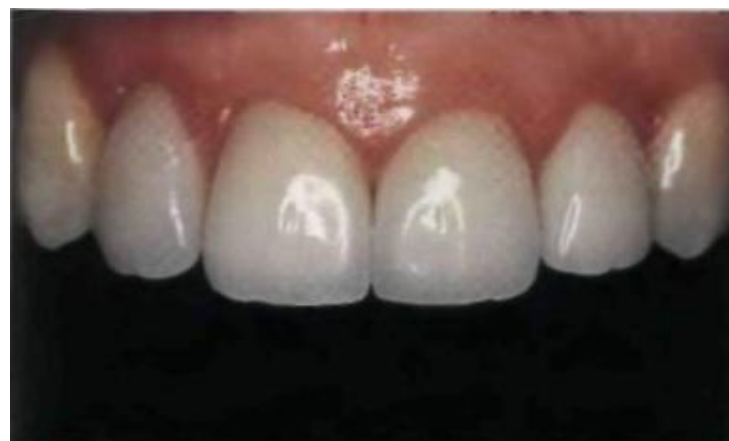
Эстетический результат четырех адгезивно фиксированных цельнокерамических жакетных коронок