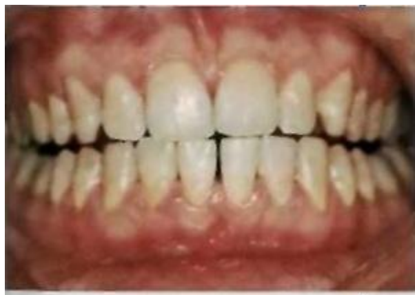
Зубы после сеанса микроабразии и обработки гелем разбавленной соляной кислоты