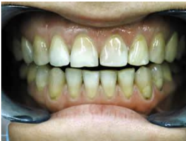
Общий вид передней группы зубов до реставрации