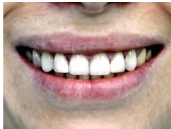
Внешний вид после реставрации