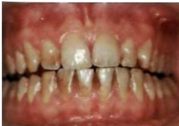
Пациент с зубным окрашиванием вследствие поверхностного никотинового отложения