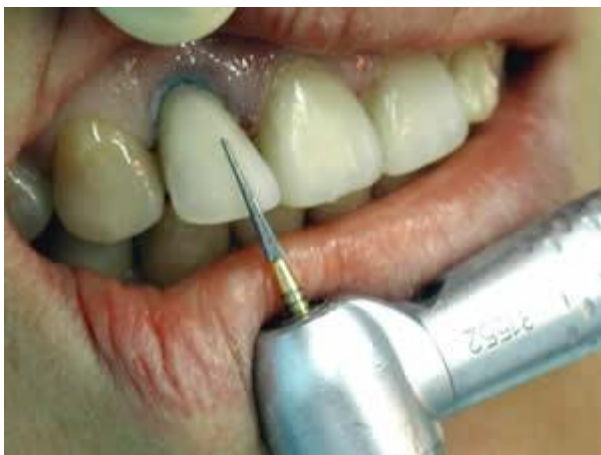
Этап окончательной обработки эстетической реставрации борями