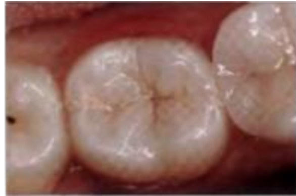
Керамическая вкладка во втором моляре, имеется хорошая цветовая интеграция с полупрозрачным полимерным цементом.