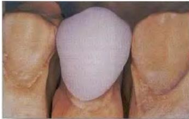
Коронка на рабочей модели