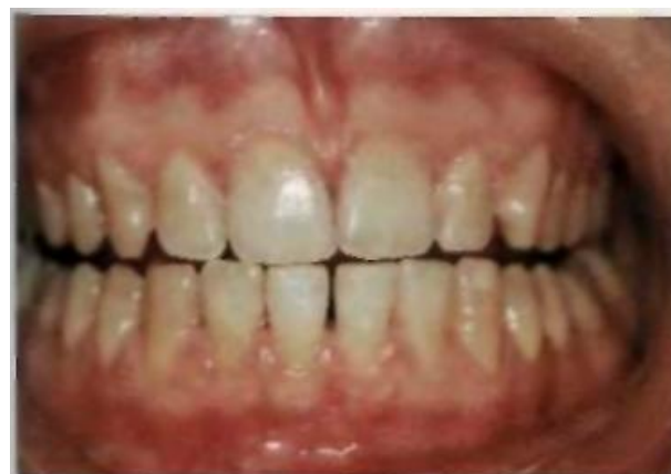
Результат после тщательного полирования