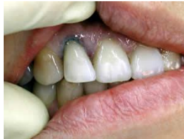
Один из этапов эстетической реставрации