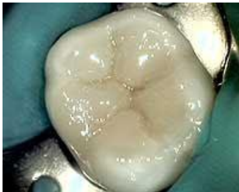
Естественный вид восстановленного зуба