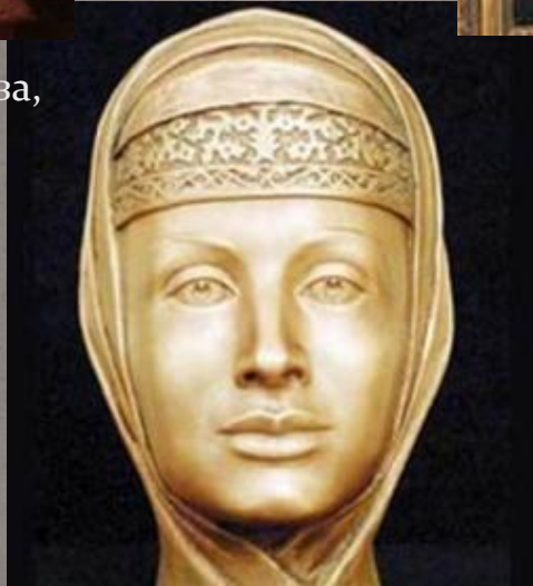
Марфа Собакина, третья жена.