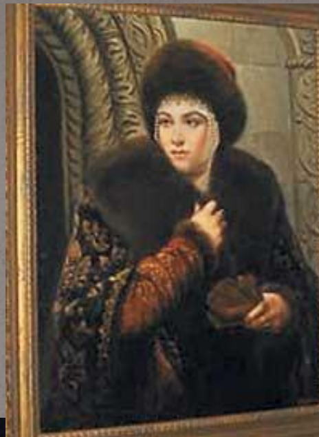
Мария Темрюковна, вторая жена.