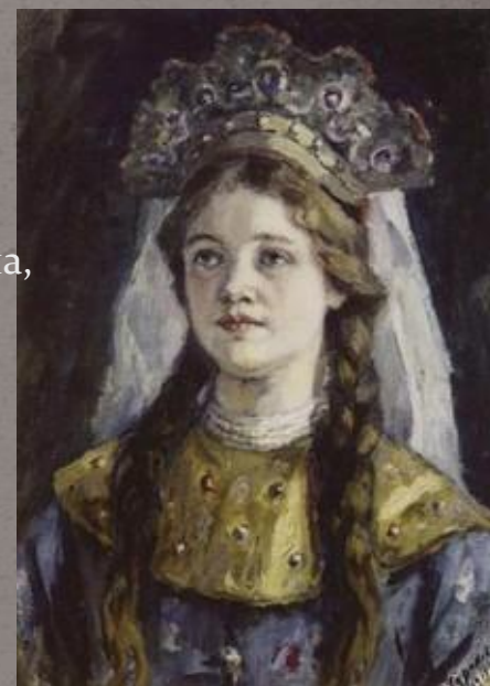
анна колтовская четвертая жена ивана грозного