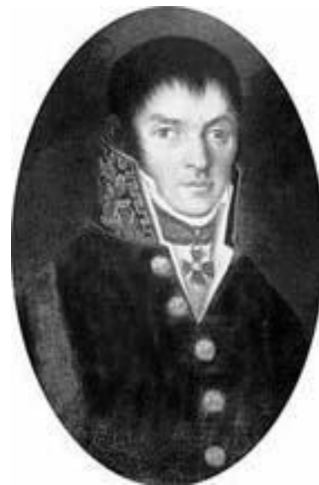
Христофор фон Оппель