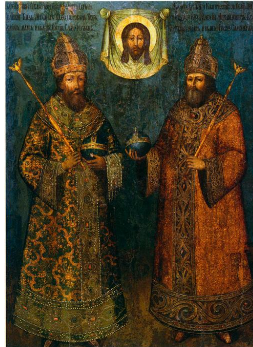
Царь Михаил Федорович и царь Алексей Михайлович, предстоящие перед образом Спаса Нерукотворного.