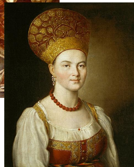
Портрет неизвестной крестьянки в русском костюме