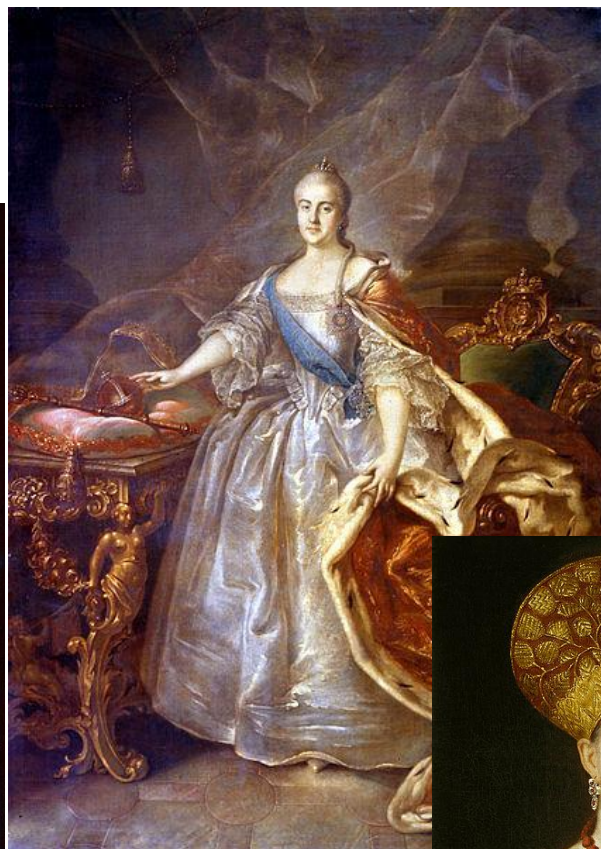
Портрет Екатерины II