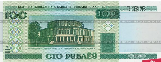
Денги Белоруссии - 100 рублей