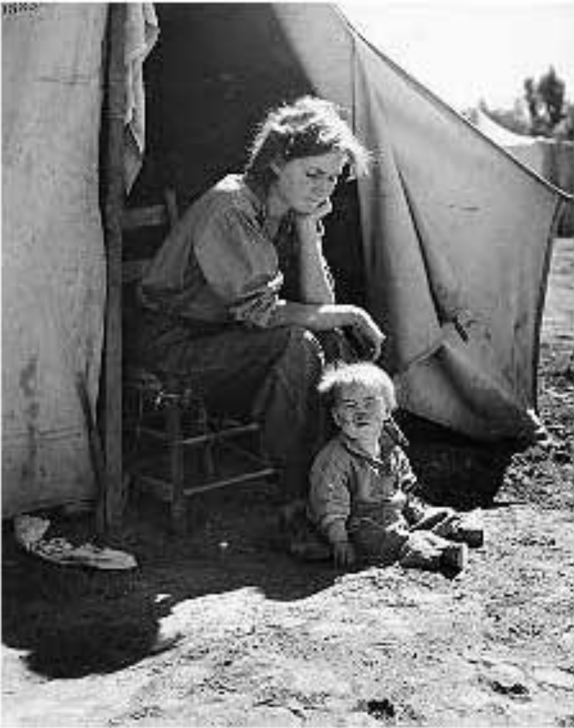
Без дома и без

1. Признание принципов коллективно-договорной практики в качестве национальной политики США и механизма регулирования конфликтующих интересов рабочих и предпринимателей