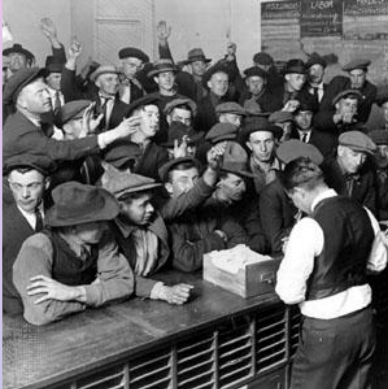
На бирже труда