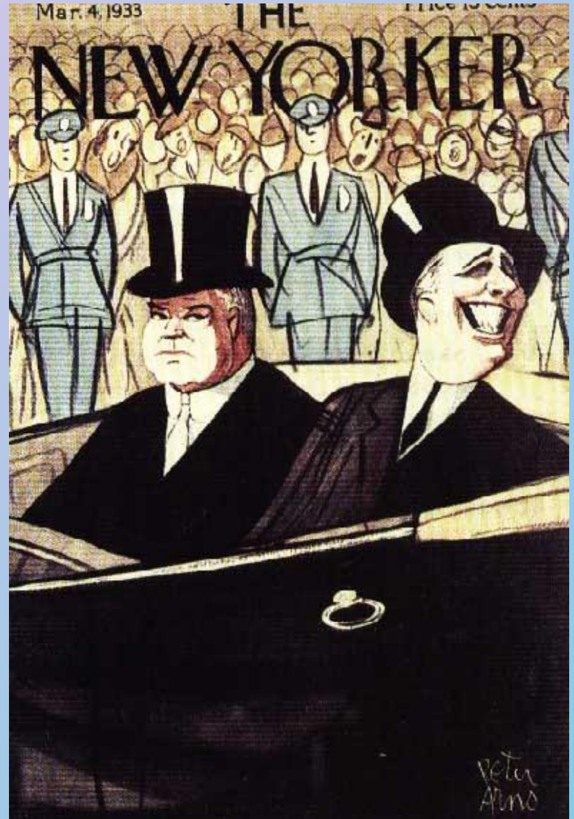
Гувер и Рузвельт