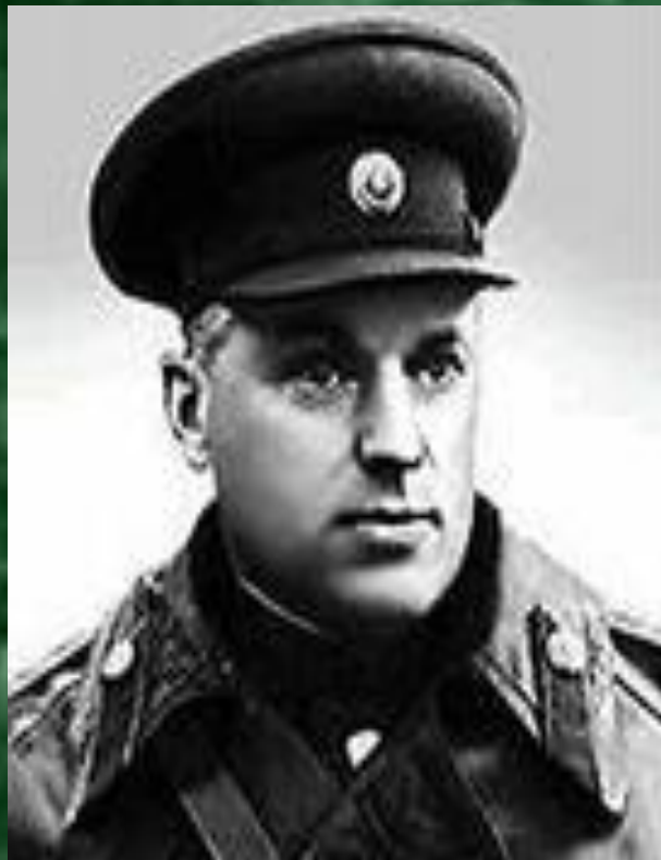
Рокоссовский Константин Константинович