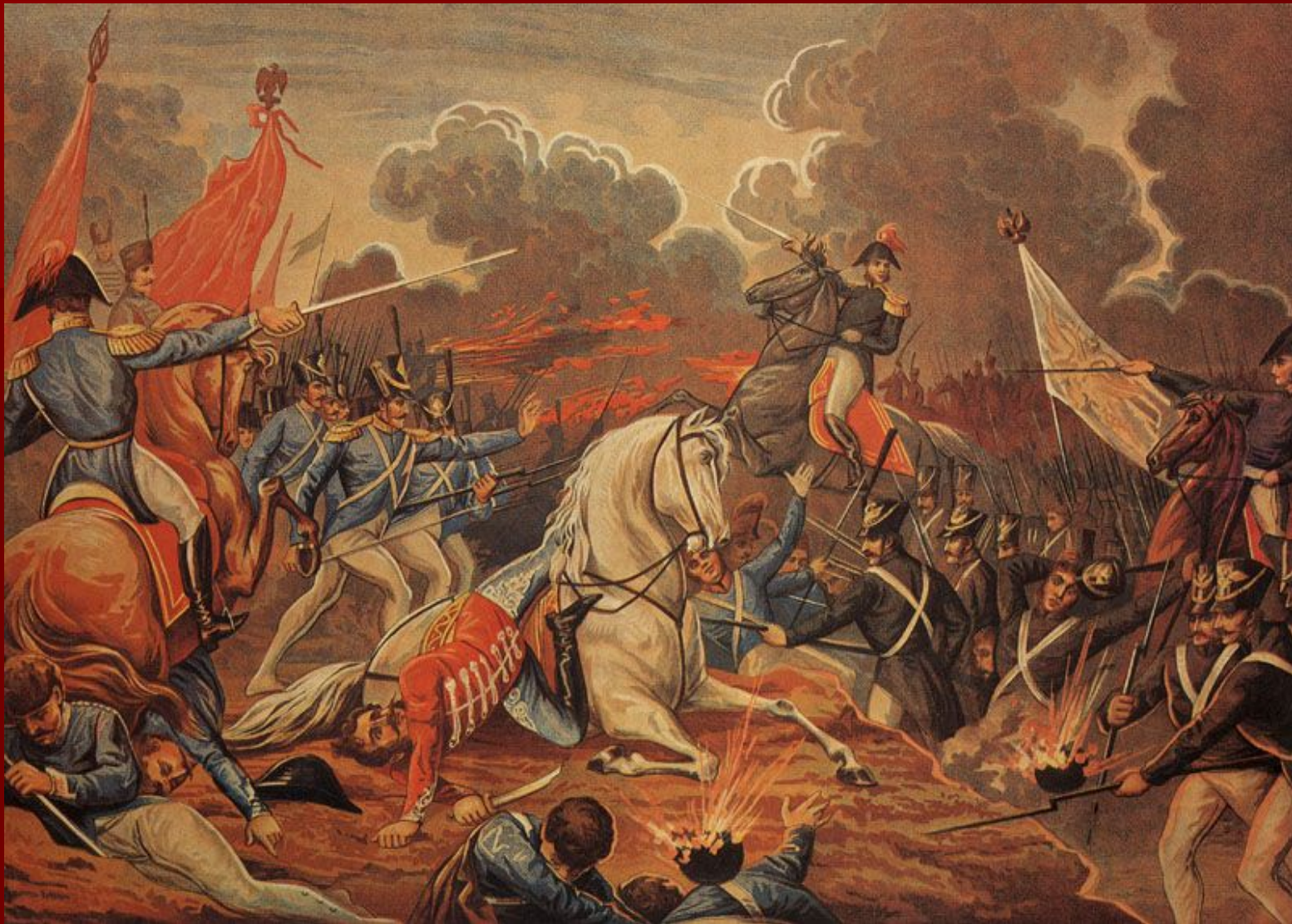
Контратака А. П. Ермолова на батарею Раевского. Хромофотография А. Сафонова.