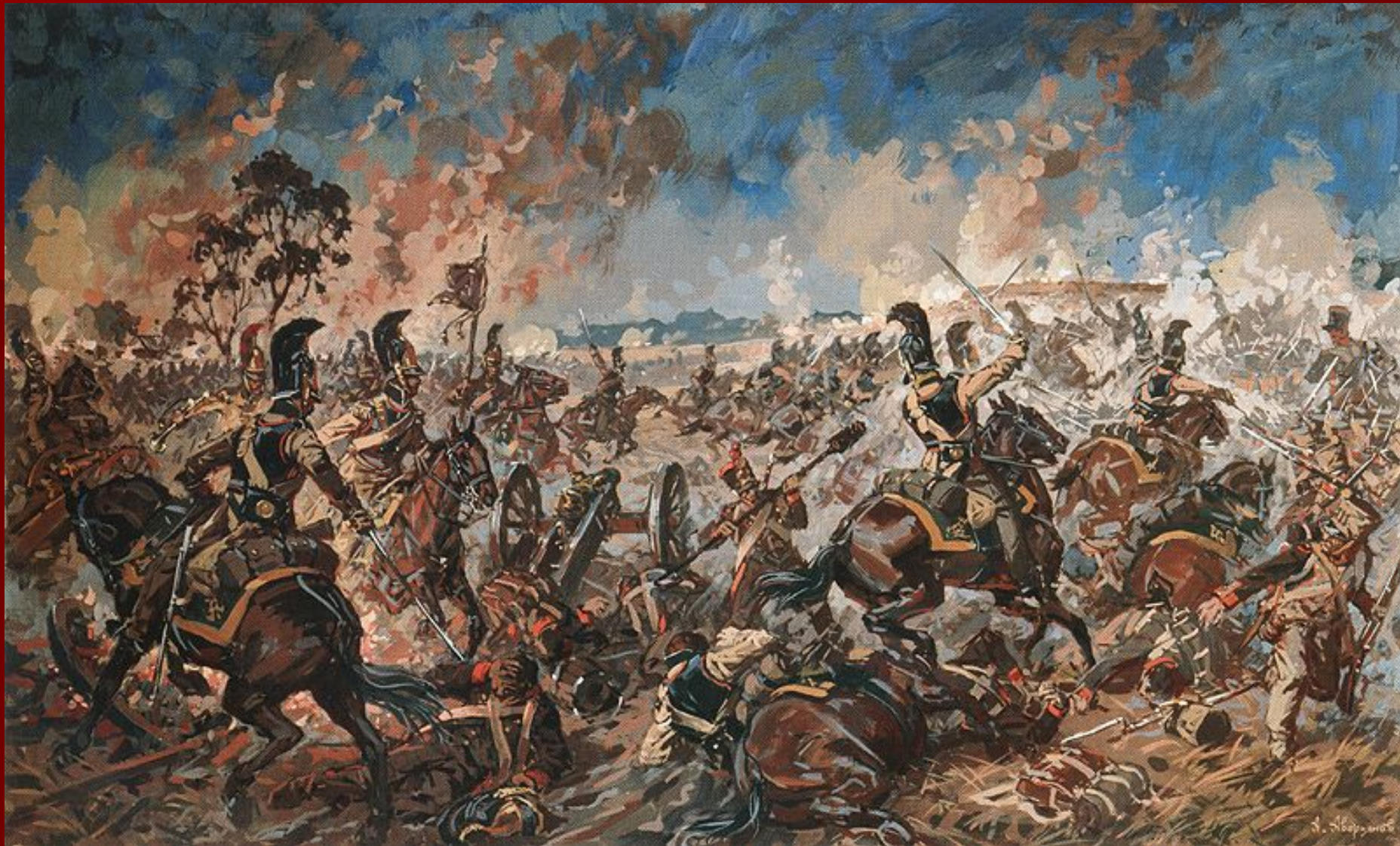
Бой за Шевардинский редут. Художник А.Ю. Аверьянов.