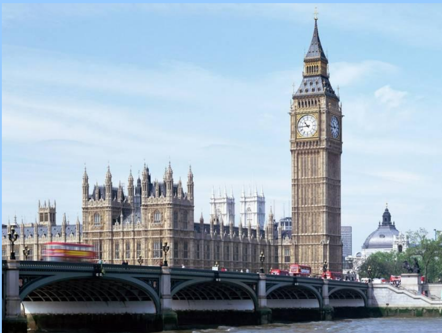
Старинная башня с часами Биг Бен (Big Ben)