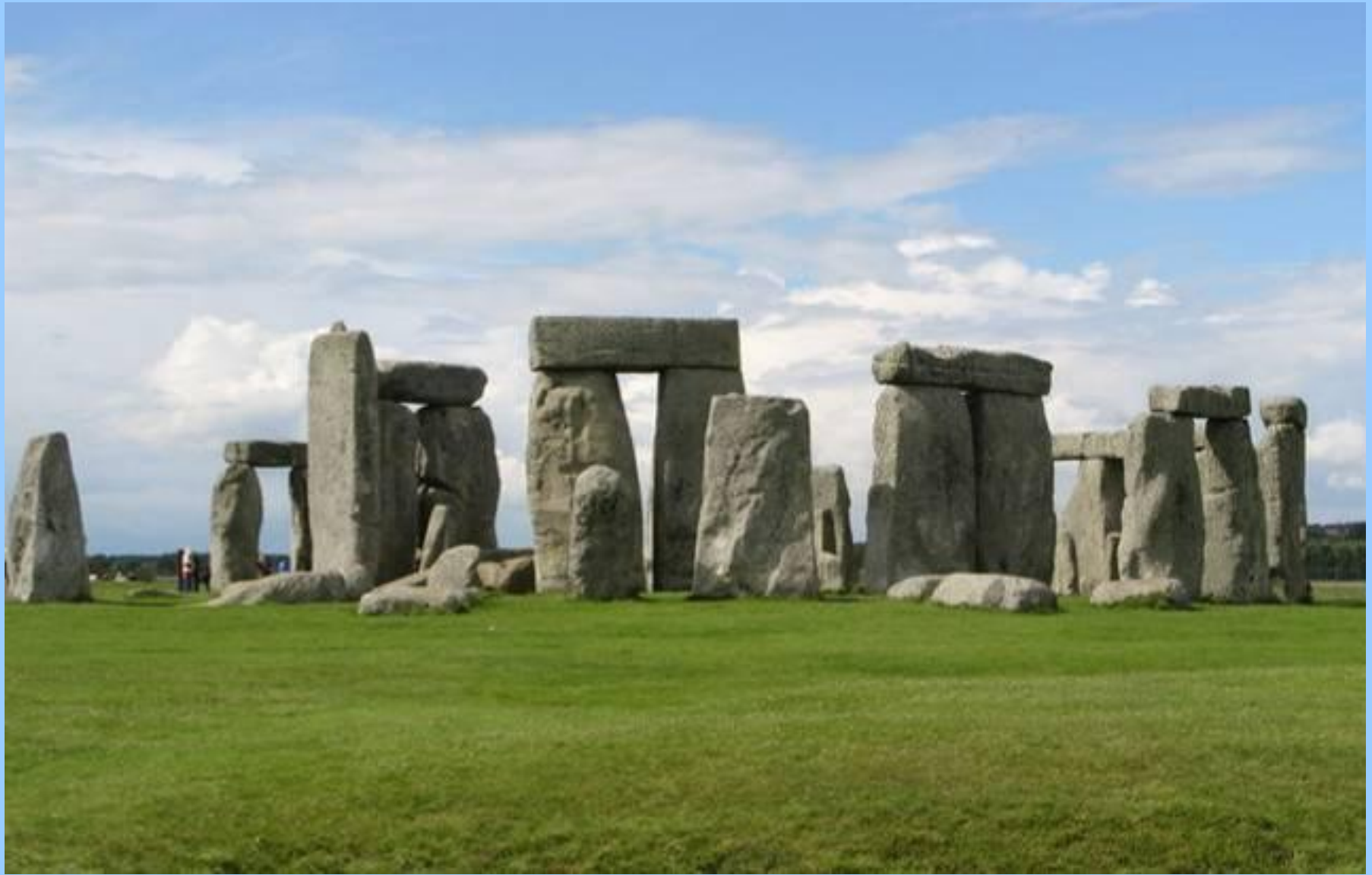
Доисторическое собрание каменных глыб - Стоунхендж