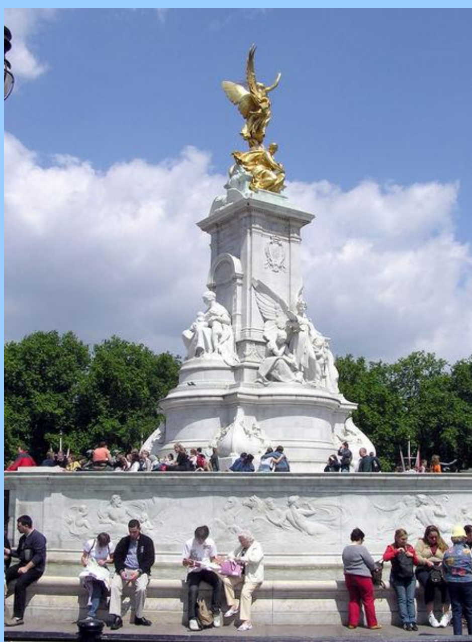
На площади возле дворца находится мемориал Королевы Виктории