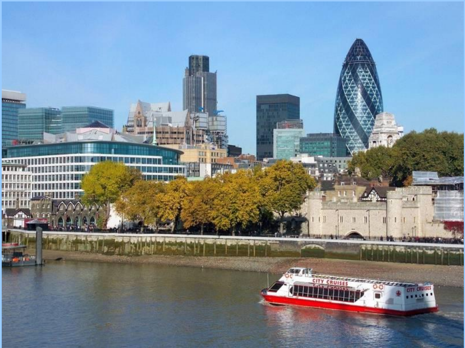
Столица Британии – Лондон.