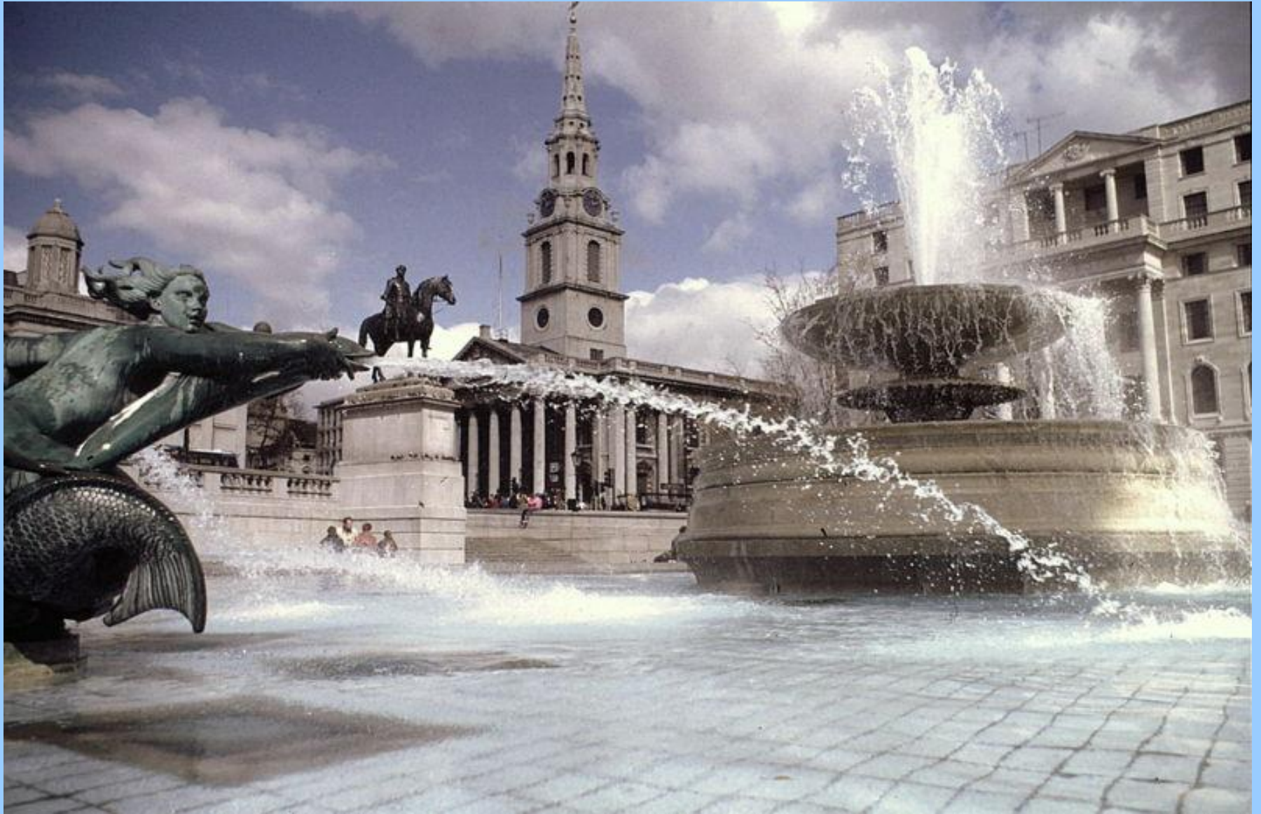
Достопримечательности Великобритании - Трафальгарская площадь