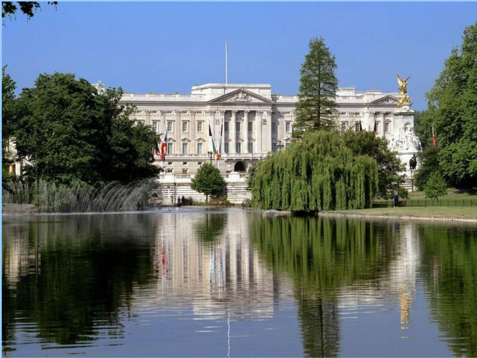
Королевская резиденция - Букингемский дворец