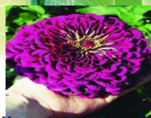
Цинния «Калифорнийский гигант»