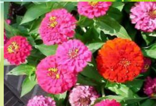
Цинния «Женские штучки»