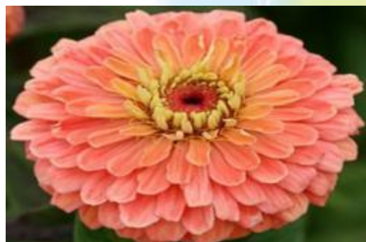
Цинния «Фантазия лосося»