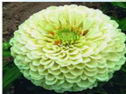
Цинния «Полярный медведь»