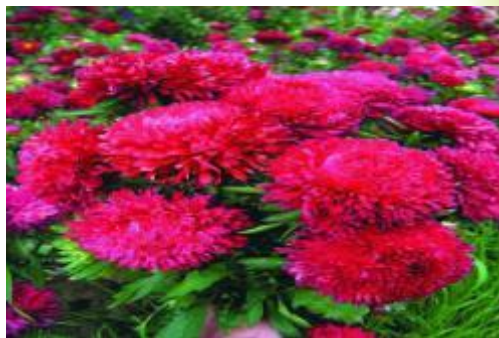
Астра «Леди Гамельтон»