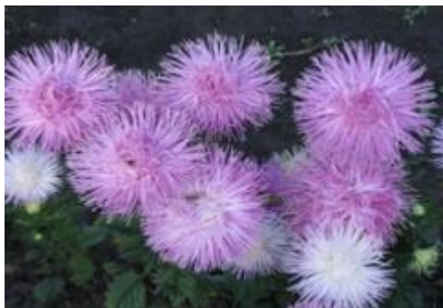
Астра «Утренняя дымка»