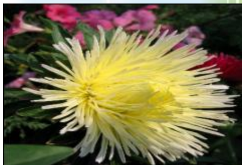
Астра «Уникум Еллоу»