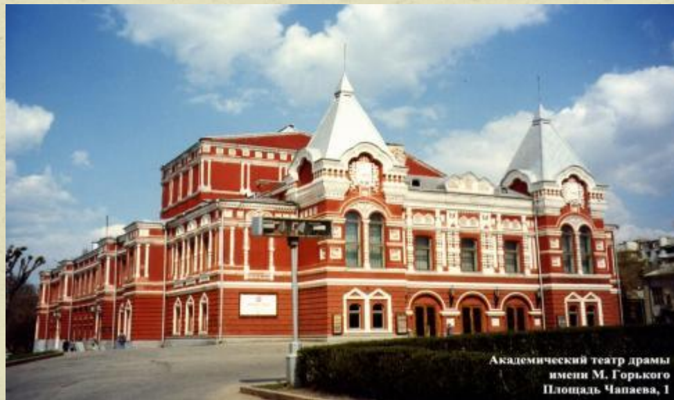
Академический театр драмы имени М. Горького Площадь Чапаева, 1