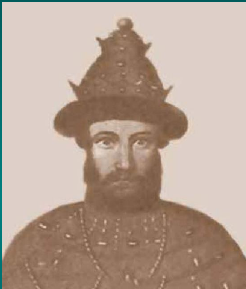
ВАСИЛИЙ II Васильевич Темный (1415-1462), московский великий князь с 1425 года, сын Василия I Дмитриевича.