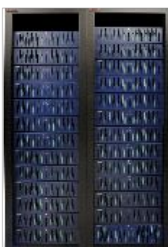
Хранение электронных документов