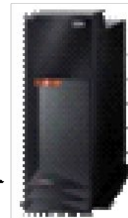
Индексация и поиск документов