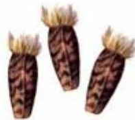
Плоды лопуха (репейника)