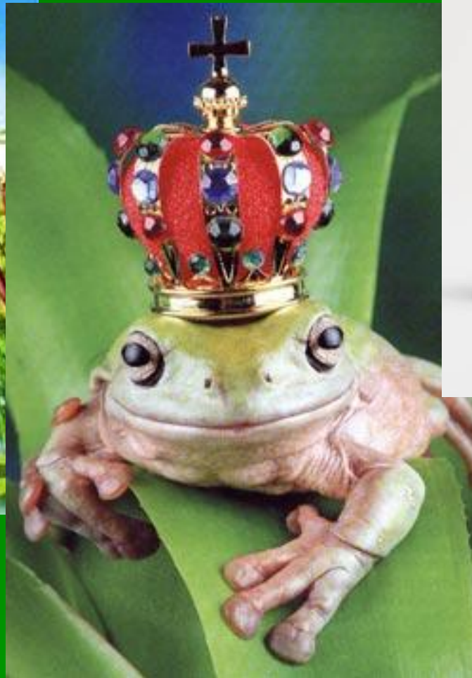
Хекет. Древний Египет