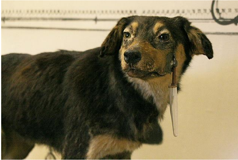
Собака Павлова, Музей Павлова, 2005

В Мадридском докладе, сделанном на русском языке, И. П. Павлов впервые сформулировал принципы физиологии высшей нервной деятельности, которой он и посвятил последующие 35 лет своей жизни. Такие понятия как подкрепление, безусловный и условный рефлекс, стали основными понятиями науки о поведении