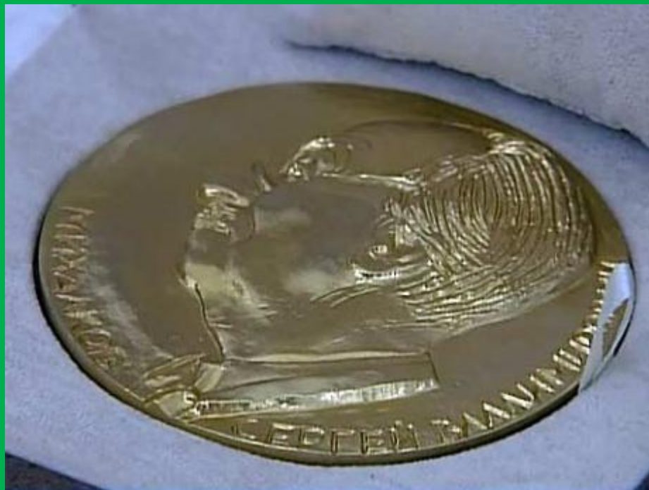
Памятная Золотая медаль имени Сергея Михалкова