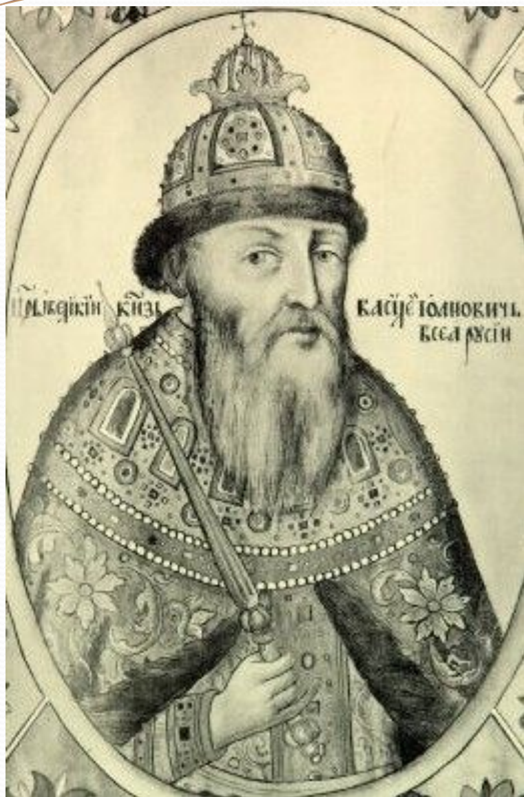
Василий Иванович Шуйский