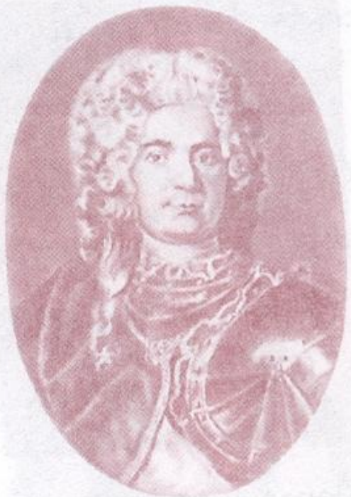
Павел Иванович Ягужинский, генерал-прокурор Сената