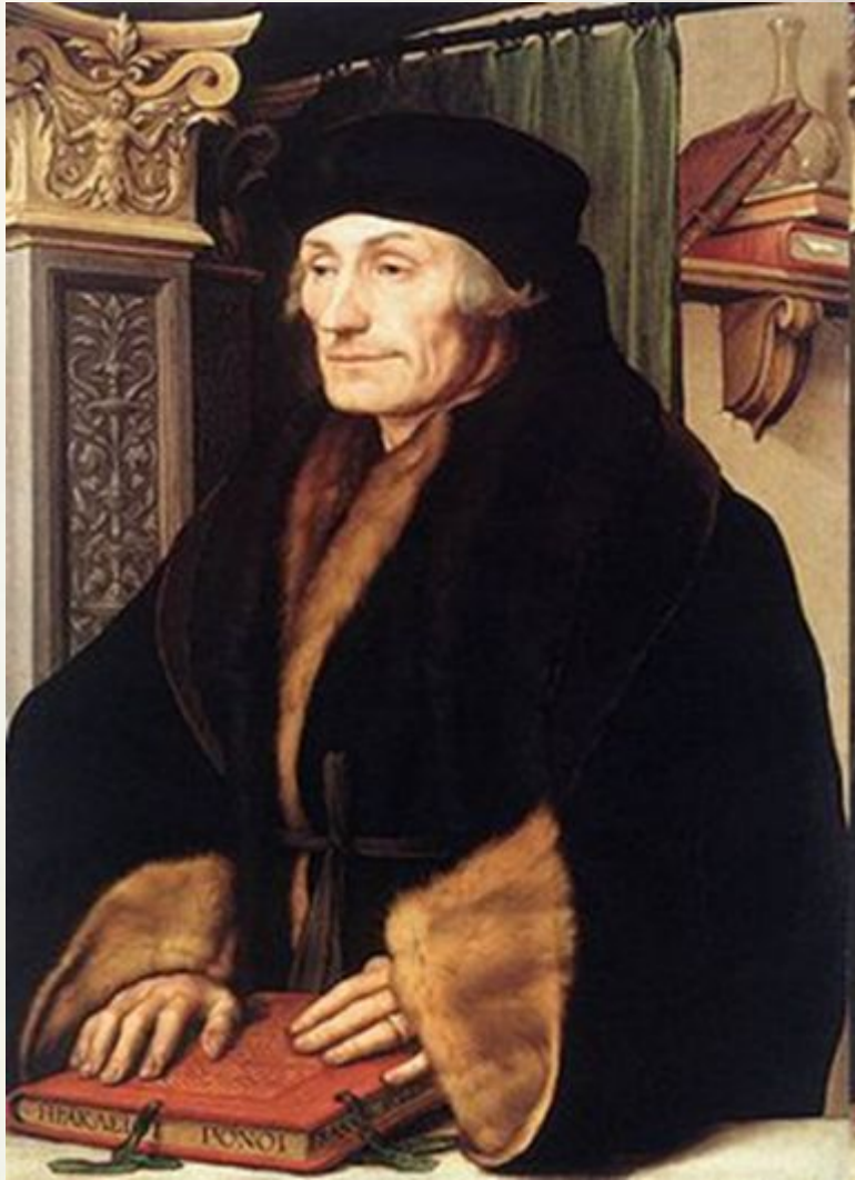
Эразм Роттердамский (1469 - 1536)

С. Цвейг, писатель, биограф гуманиста, назвал гуманиста «славой и светочем своего времени».