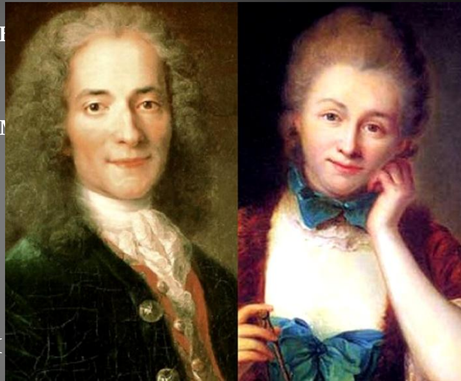
Вольтер и Эмилия дю Шатле

Издание книги вызвало негодование французских властей, и Вольтер снова был вынужден покинуть Париж. Большую часть следующих пятнадцати лет он прожил в Цири в восточной Франции, где был возлюбленным мадам дю Шателе, красивой, образованной жены маркиза. В 1750 году, через год после ее смерти, Вольтер поехал в Германию по личному приглашению прусского короля Фридриха Великого. Три года он провел при дворе Фридриха в Потсдаме. Сначала Вольтер подружился с образованным, умным хозяином, но в конце концов они поссорились, и в 1753 году Вольтер покинул Германию.