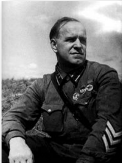
Комдив Г. Жуков на Халхин-Голе

1939 г. – вторжение Японии в Монголию. СССР оказал военную помощь Монголии. Вооружённый конфликт, продолжавшийся с весны по осень 1939 года у реки Халхин-Гол на территории Монголии, закончился разгромом японских войск.