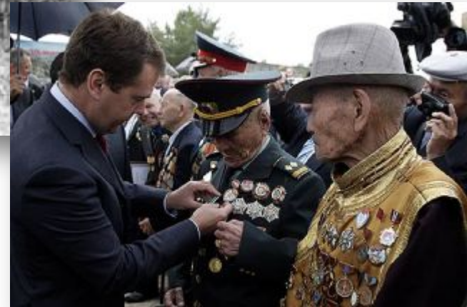
Д. А. Медведев вручает российские награды ветеранам Халхин-Гола (Улан-Батор, 2009)