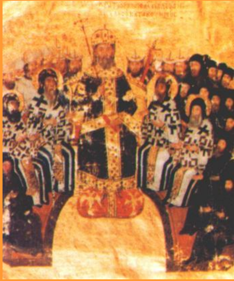
Вселенский собор в Ницце 325 г. Фреска.

При Константине количество христиан возросло.