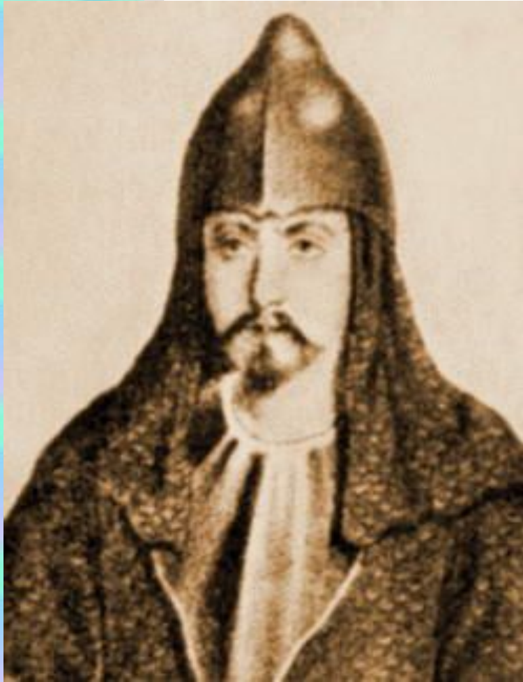
Великий киевский князь Игорь (912-945)

Неудачный поход Игоря на Византию – 941 год (византийцам помог «греческий огонь»). В 944 г. он повел на Византию новое войско. Но тут греки запросили мира. Глубокой осенью князь вместе с дружиной начал объезд своих владений с целью сбора дани. На Руси такой налог назывался полюдьем. Примитивная налоговая система, как известно, это один из признаков государства