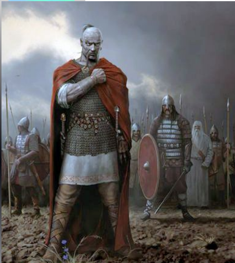
Князь Святослав – русский Александр Македонский