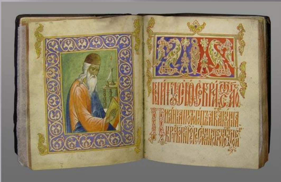
Житие протопопа Аввакума.