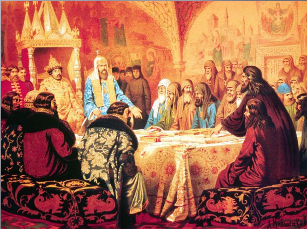
Церковный Собор 1654 года (Патриарх Никон представляет новые богослужebные

Было введено крещение тремя пальцами, поясные поклоны вместо земных, исправлены по греческим образцам церковные книги.