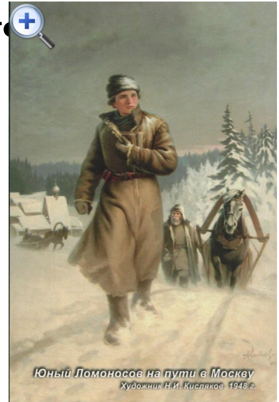
Юный Ломоносов на пути в Москву Художник Н.И. Кисляков. 1948 г.

Примерно так выглядел дом поморов Ломоносовых.