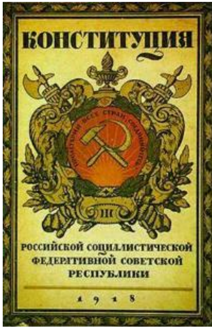
Конституция РСФСР 1918 г.

9 июля 1918 г.V Всероссийский съезд Советов возобновил работу.10 июля он принял Конституцию РСФСР, которая провозглашала Советскую власть в форме диктатуры пролетариата и беднейшего крестьянства. Высшим органом власти становился Съезд Советов, а в промежутках между Съездами-ВЦИК.Исполнительная власть принадлежала Совнаркому.