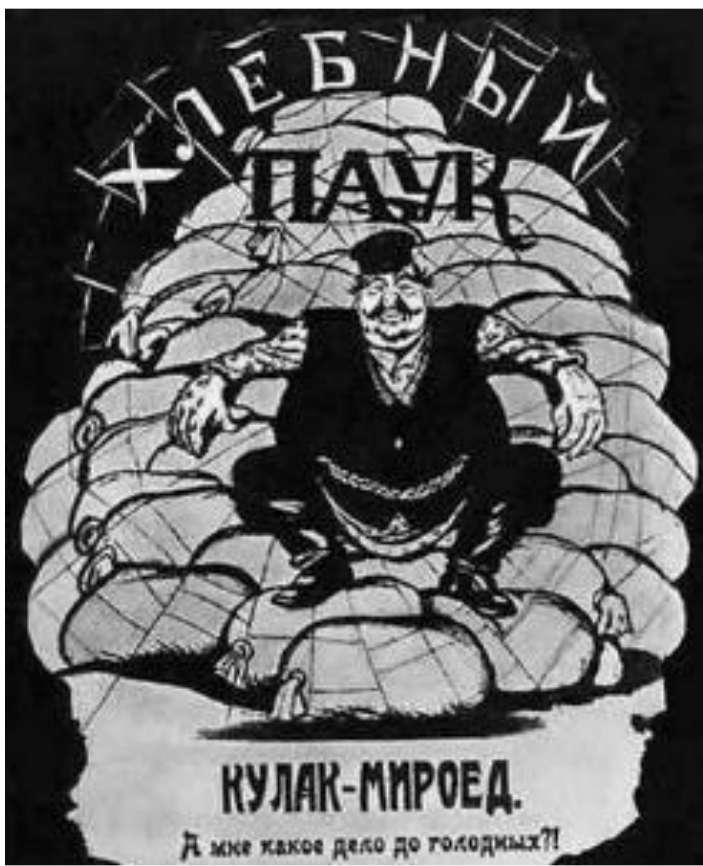
В.Дени. Хлебный паук.

В начале для получения продовольствия правительство использовало товарообмен, но в условиях развала экономики промышленных товаров не хватало и крестьяне не спешили отдавать хлеб государству в обмен на реквизиционные чеки. Над страной нависла угроза голода. В столицах выдавали по 50-100 г хлеба в сутки на человека. 13 мая ВЦИК установил душевые нормы потребления хлеба для крестьян. Весь хлеб сверх установленной нормы подлежал конфискации.