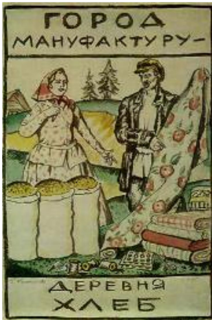
Плакат 1925 г.

Госсектор был малопродуктивным. Нэпманы держали накопления в тайниках, опасаясь их повторного изъятия. Средняцкие хозяйства в деревне не могли поставлять большое количество товарного хлеба для продажи его за границу. Это привело к сокращению закупок иностранной техники почти в двое, а собственное производство было малоразвито. Все это привело к замедлению темпов экономического роста во 2-й пол. 20-х гг.