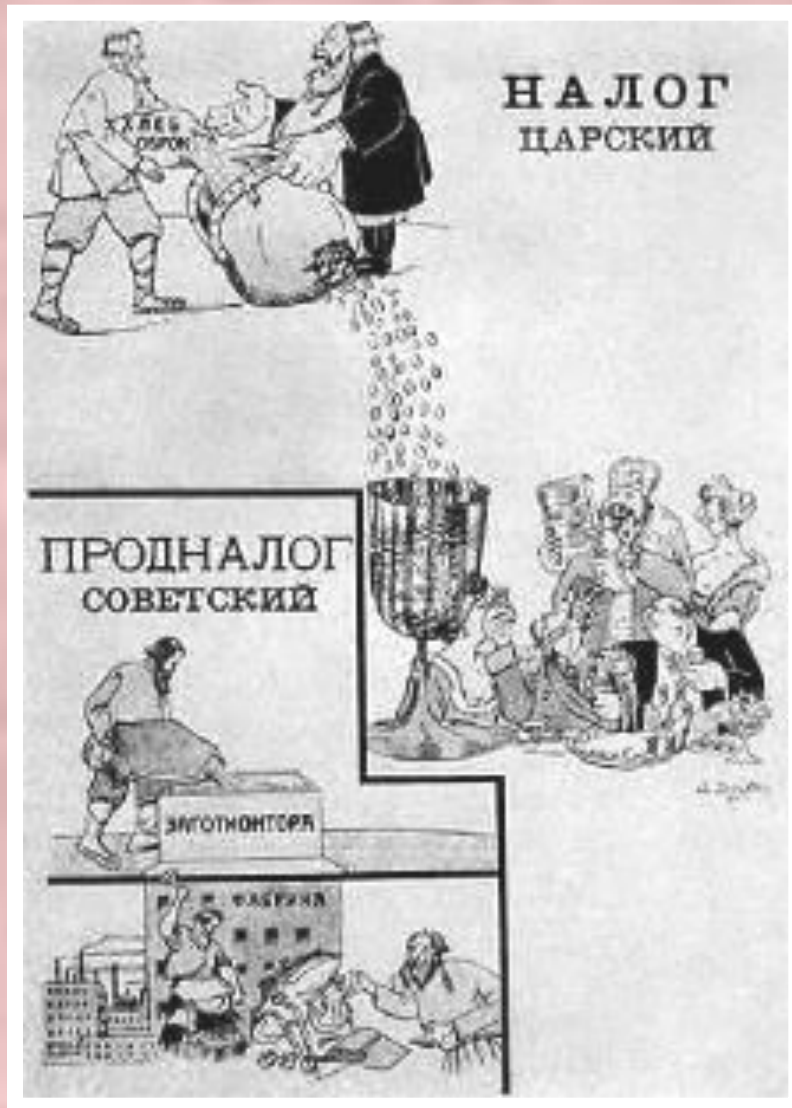
Плакат 1921 г.

Это потребовало отмены принудительного труда, введения тарифной системы зарплаты, формирования рынка труда. Была проведена денежная реформа - восстанавливалось денежное обращение. Был выпущен «золотой червонец». В то же время крупные предприятия остались в руках государства. В 1923 г. были созданы тресты и синдикаты, работавшие на самоокупаемости. Ленин считал, что НЭП вводится «всерьез и надолго».