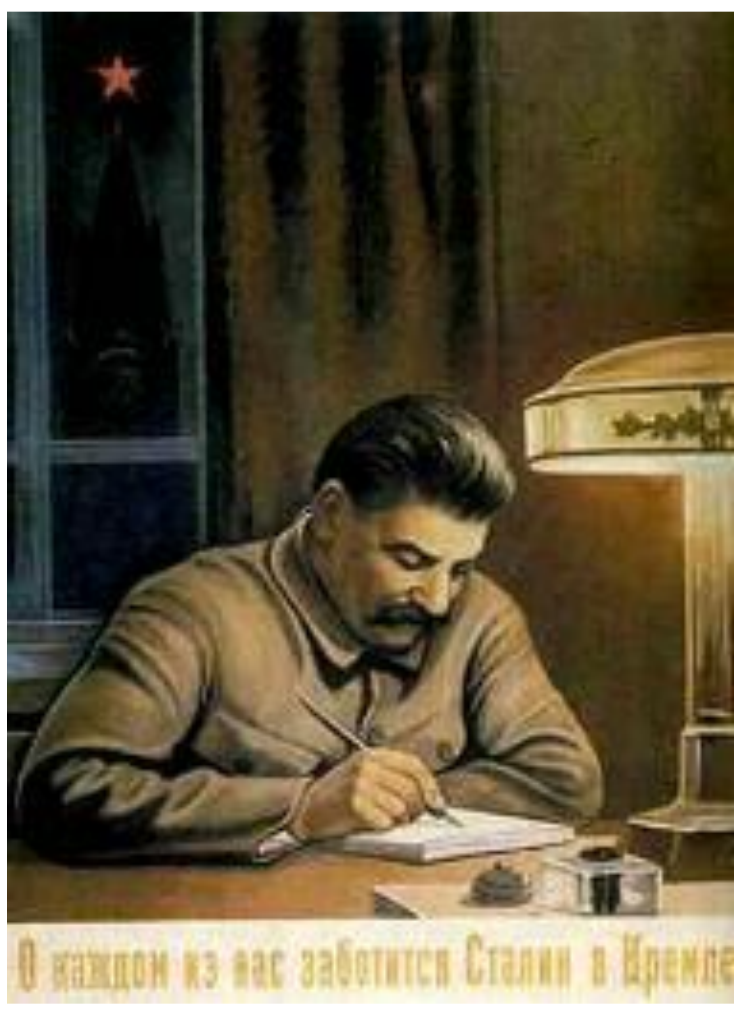
Плакат 1932 г.

Характерной чертой политической жизни этого периода стал культ личности И. Сталина. 21 декабря 1929 г., в день 50-летия Сталина, страна узнала, что у нее есть великий вождь. Он был объявлен «первым учеником Ленина». Вскоре Сталину стали приписывать все успехи страны. Он именовался «великим», «мудрым», «вождем мирового пролетариата», «великим стратегом пятилетки».