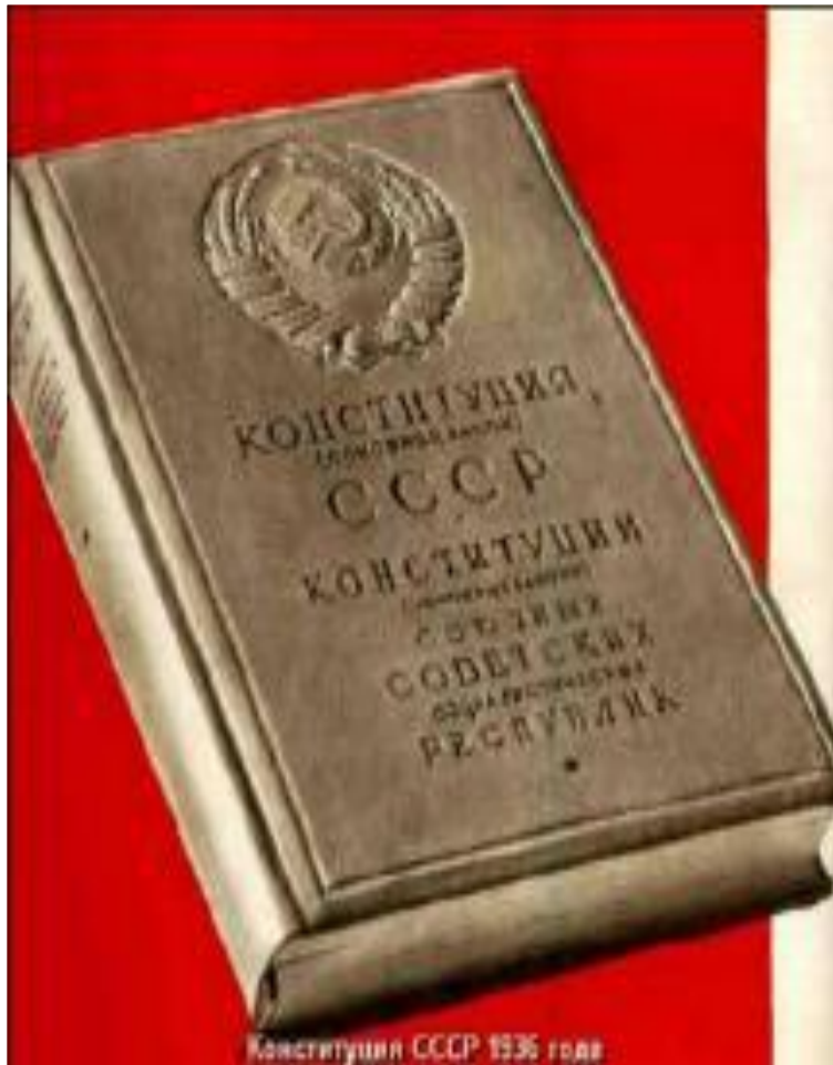
Конституция 1936 года.

«Большой террор» был призван снять социальную напряженность, вызванную неудачами экономических и политических решений руководства. Этой же цели соответствовала Конституция принятая 5 декабря 1936 г. Она провозглашала демократические права и свободы и маскировала тоталитарный режим. Конституция провозгласила построение в СССР социализма и создание государственной и колхозно-кооперативной собственности средства производства.